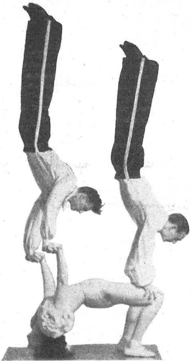
The tree Carolls