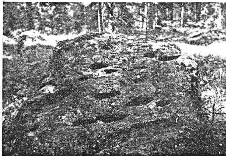
Älvstenar på Kvarnaberget i Gusselby

längd och likaså bredd är ungefär 120 cm., höjden, lodrätt räknad, 80 cm.; formen är tämligen oregelbunden, uppåt avsmalnande till en kam, bergarten grönsten. Alltså en hård sten, som inte visar några spår till vittring, och det är därför inga tvivel om att de talrika fördjupningarna äro inhuggna av människohand. Jag räknade på stenens åt NNO vettande sida till 18 stycken sådana hål av mycket olika stor-