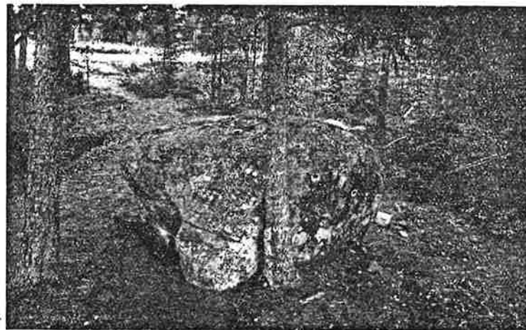
Offerstenen vid Bor