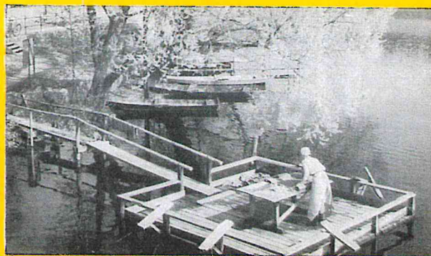
4. En idyll som tjuvar.

Vi tror att Ni skall trivas hos oss och att Ni alltid skall känna Er lika välkommen till Lindesberg, en vacker stad i betagande bergslagsbygd.