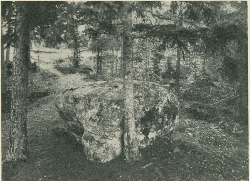
Fig. 2. »Älvstenen» vid Bor's bruk, Västmanland.

stenblocket. Längden torde i själva verket knappast understiga 3 meter. Vidare bör om den nu för tiden nära intill Frövi—Ludvika järnväg belägna stenens utseende nämnas, att jämte de av Hyltén-Cavallius omtalade fem hålen på stenens ovasida finnes ännu ett, ehuru mindre och grundare. Skulle det möjligen vara senare tillkommet? Utom dessa fördjupningar, vilka alla, för att begagna doktor K. Kjellmarks träffande terminologi, 1 äro »fickformiga» och sannolikt visa en yngre älvkvarnstyp än de »skålformiga» fördjupningar, som företrädesvis fått namn av älvkvarnar, har i senare tid på stenens ovasida inhuggits en likbent triangel med 46 cm:s bas och 38 cm:s ben, vilken omsluter tre 12—14 cm:r höga runor \nabla \cdot \nabla \cdot \nabla . Denna ristning, vilken man icke kan undgå att stämpla såsom ett beklagansvärt attentat mot den gamla offerstenen, omtalas icke av Hyltén-Cavallius men torde dock, av hörsägner och indicier att döma, hava tillkommit minst tre årtionden innan denne begynte utgivandet av sin