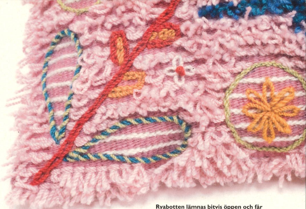
Ryabotten lämnas bitvis öppen och får spela med i mönstret tillsammans med nockor och broderier.

Och hur kommer man att lyckas i uppsåtet att nå unga, som kanske inte slöjdat förr? Vem vet. Svaret får vi kanske i form av något yvigt, rosaaktigt som plötsligt börjar sticka upp ur väldigt många kassar på stan, som plockas fram på bussar och tåg och som med tiden pryder studentrum och second hand-soffor. ♦