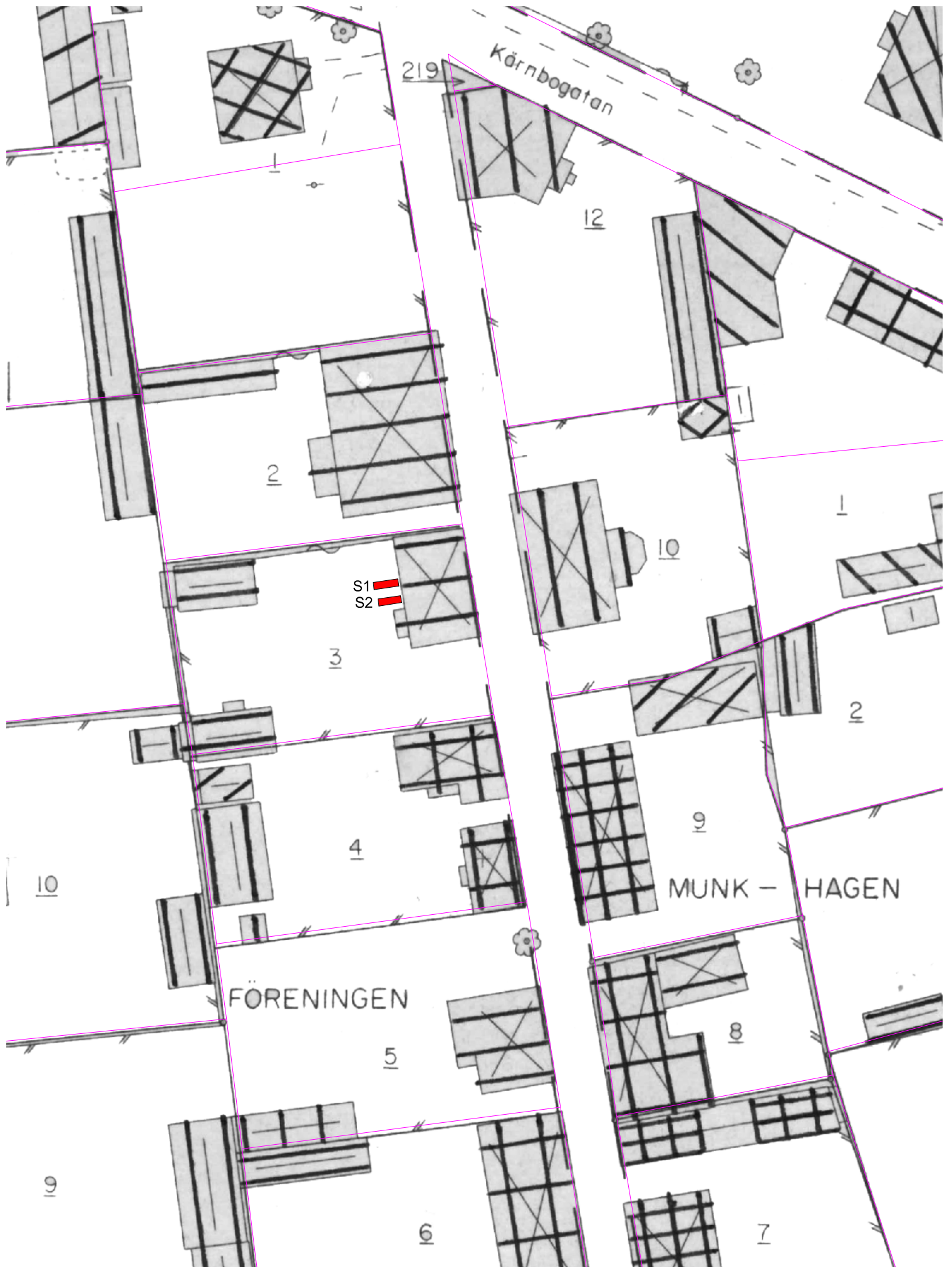
Bilaga 1. Läget för de två förundersökningsschakten (1-2) på fastigheten Föreningen 3, Munkhagsgatan, Mariefred. Fornlämning Mariefred 21:1. Skala 1:500.