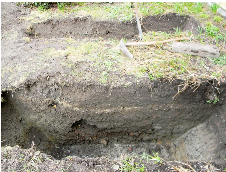
Bilaga 3. Överst: Undersökningsschakten 1 och 2 intill den befintliga byggnaden på fastigheten Föreningen 3, Mariefred. Mitten: Schakt 1, norra profilen från söder. Nederst: Schakt 2, norra profilen från söder. Jämför bilaga 2, Profilirtningar.