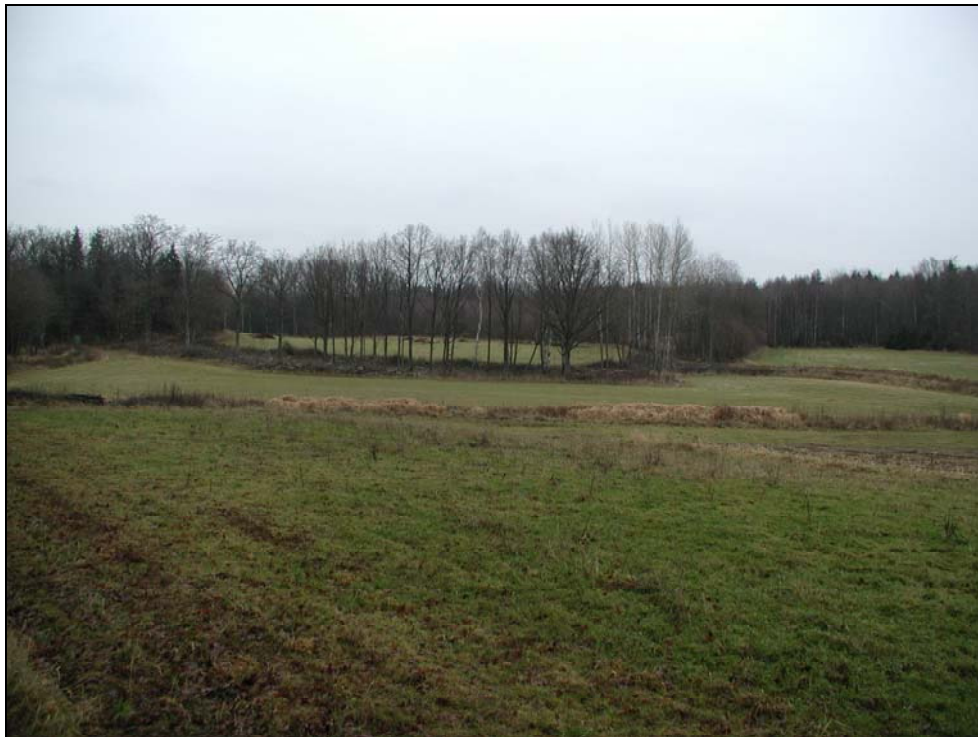
Fig.2 – Översikt över utredningsområdet mot N.

Utredningsområdet var uppdelat i två stycken, åtskiljda av ett omfattande, delvis trädbevuxet parti röjningssten. Det norra stycket omfattade ca 7500 m 2 och det södra ca 5000 m 2 . Området utgjordes vid tiden för utredningen av åkermark i träda, och den delvis kuperade terrängen var belägen mellan 30 och 40 m.ö.h. (se fig. 2). Avsikten med den särskilda utredningen var att försöka utröna i vilken utsträckning tidigare okända fornlämningar kunde komma att beröras av det förestående markingreppet. Inom ramen för ett arkeologiskt fältarbete drogs sex sökschakt på de topografiskt mest lovande lägena, i hopp om att lyckas lokalisera eventuella lämningar under matjordsskiktet. Förutsättningarna för sökschaktningen styrdes till stor del av föregående veckors regn och tjällossning. Den extrema vätan omöjliggjorde därför grävning inom det södra stycket och försvårade schaktningen avsevärt inom det norra.