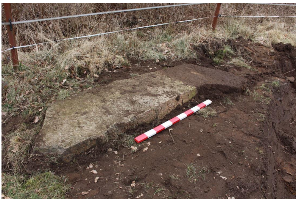
Stenen lagd i förmodat läge år 2009. Foto mot SÖ.