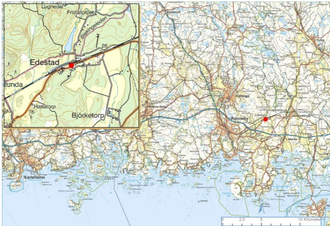
Undersökningsområdet markerat på Väggkartan resp. Terrängkartan