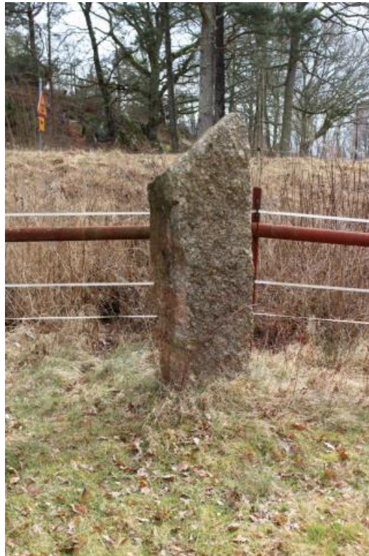
Resta stenen. Foto mot Sö