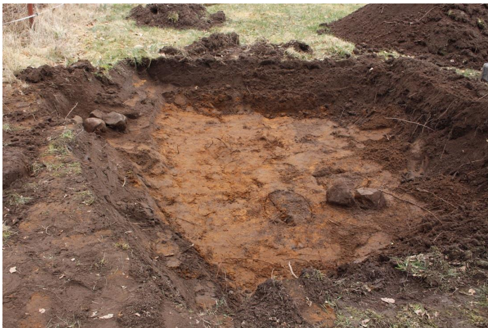
Stenar och stenbyft i undergrund.. Foto mot Ö.