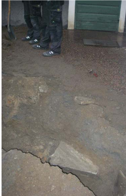
Figur 2. Kalkstensplatta utanför västra porten.