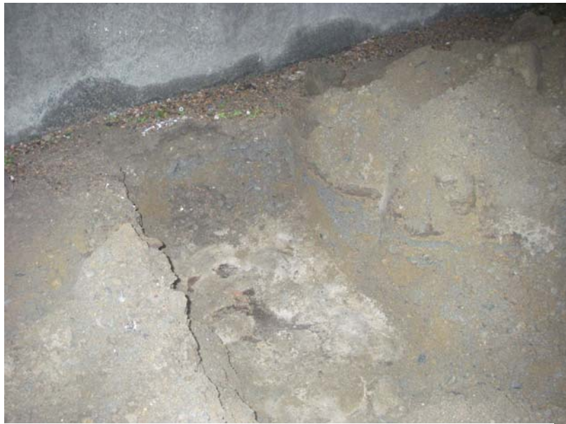
Figur 3. Kullersten vid västra porten.