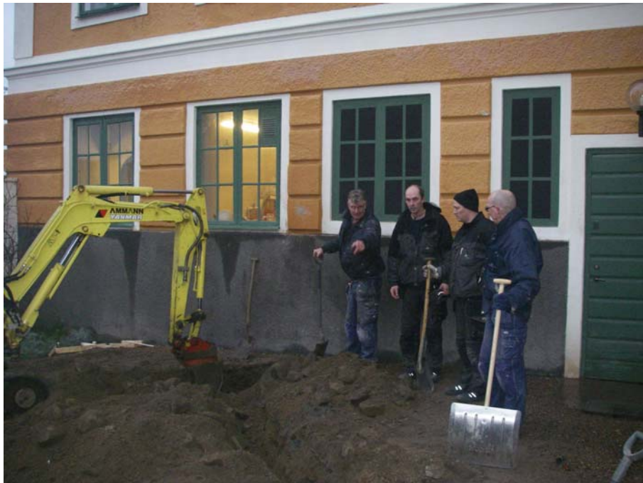
Figur 1. Arbetsbild schaktning västra porten.

Grävarbetena bestod i att cirka 40 cm breda och 40 – 50 cm djupa schakt grävdes längs med Grevagårdens sydvästra långsida, dess nordvästra kortsida, samt tvärs över gården i västlig och sydlig riktning. Gårdsplanens nutida grusbeläggning var mellan 10 – 30 cm tjock, mestadels mellan 20- 30 cm.