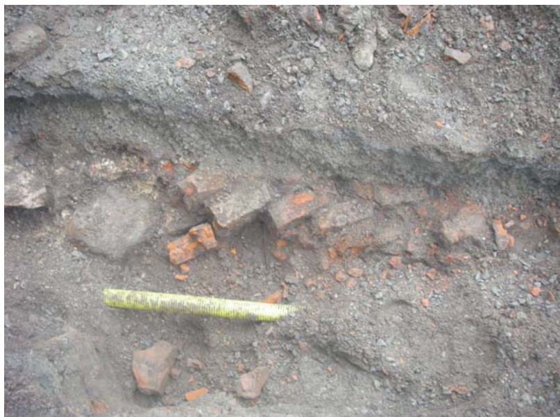
Figur 4. Tegelbyggnad 1. Foto mot öster.

I anslutning till en rabatt vid Grevagårdens östra del, rakt utanför ett blindfönster, framkom rester efter en tegelkonstruktion under det 10-20 cm tjocka sentida gruslagret. Teglet utgjordes av handslaget, 27x15x7 cm stora stenar och dessa framkom i riklig mängd upp till 260 cm från rabattkanten. Teglet var murat med kalkbruk. I schaktkantens västra sida kunde det murade och i förband lagda teglet följas ned till ett djup av 75 cm, djupare gick inte att undersöka på grund av schaktdjupet. I schaktkantens östra sida var tegelstenarna ställda på den smalare långsidan – närmast i någon sorts "valvteknik". Det skulle kunna utgöra någon sorts valv eller golv. I denna schaktvägg återfanns också två naturstenar cirka 30 cm stora. Det gick inte helt säkert att avgöra hur tjock muren var på denna sida, men under det "valvlagda" partiet tycktes det finnas kulturlager. Det "valvlagda" utgjorde förmodligen hela tjockleken det vill säga cirka 15 cm. Schaktväggarna var dock svårrensade; det var mängder med sönderschaktat tegel och ledningsrören var redan utplacerade och fick inte skadas.