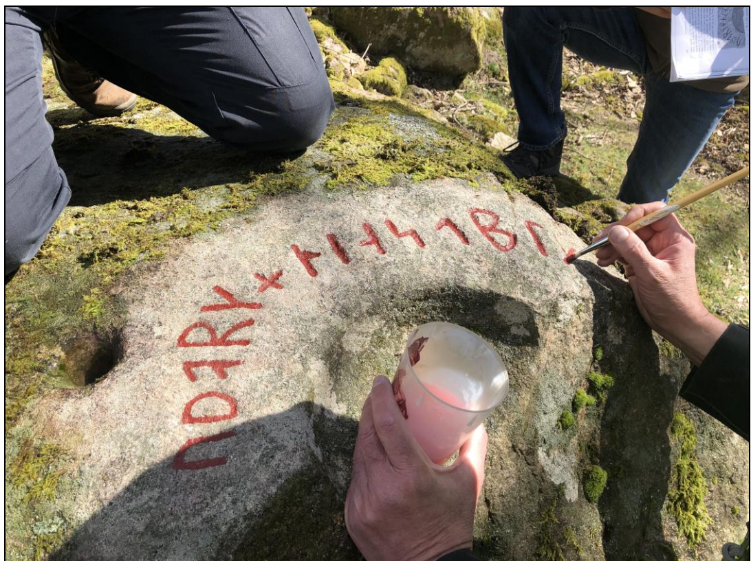
Närbild av ifyllningsarbetet