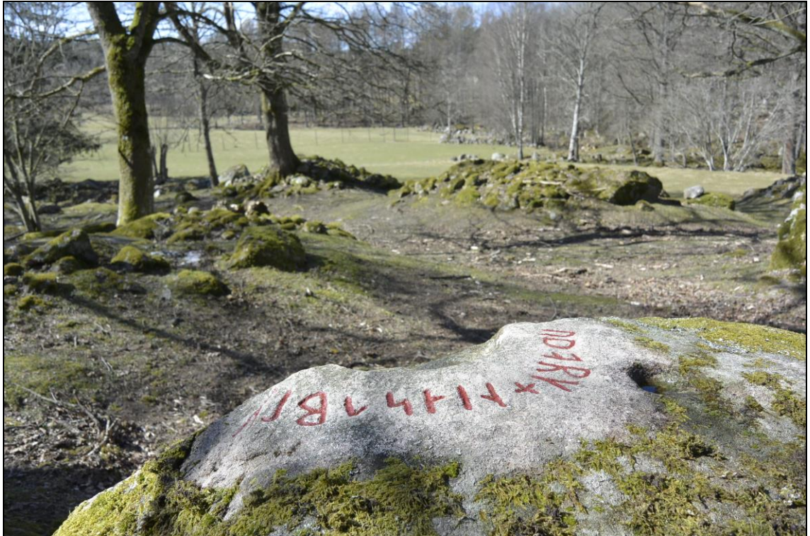
Runraden efter färdig ifyllning