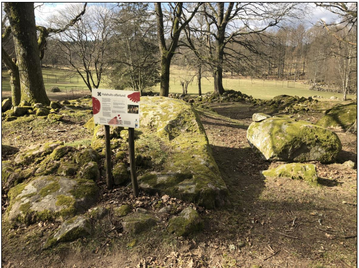
Olämplig placering av informationsskylt