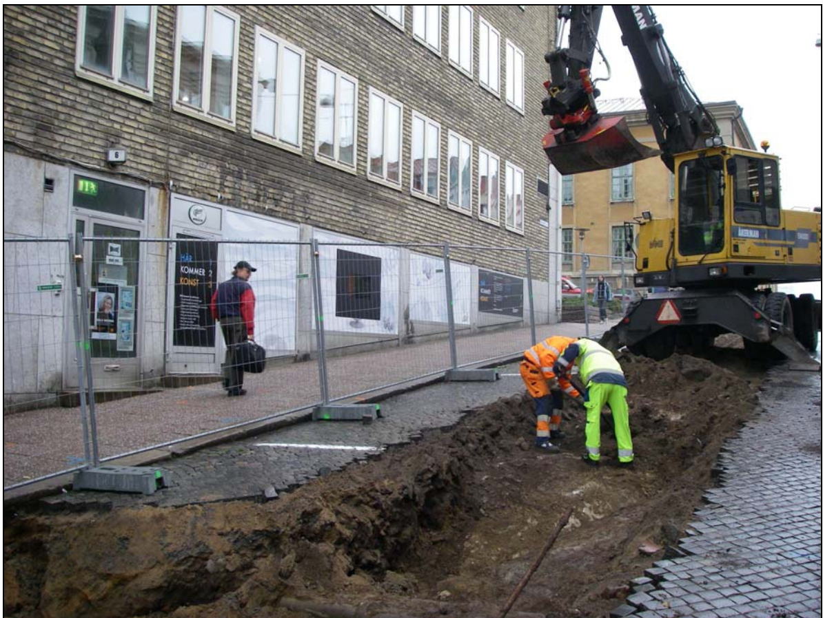
Parti av Rådhusgatan. fotograferat mot SO.