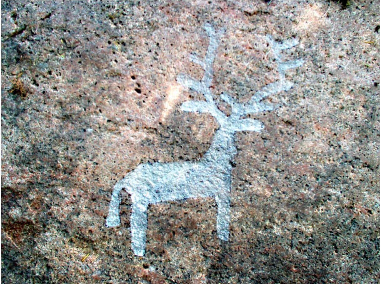
Detalj av djurfiguren. Foto Sven-Gunnar Broström 2007