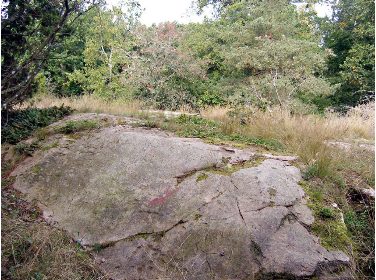
Hällristningen från Ö.