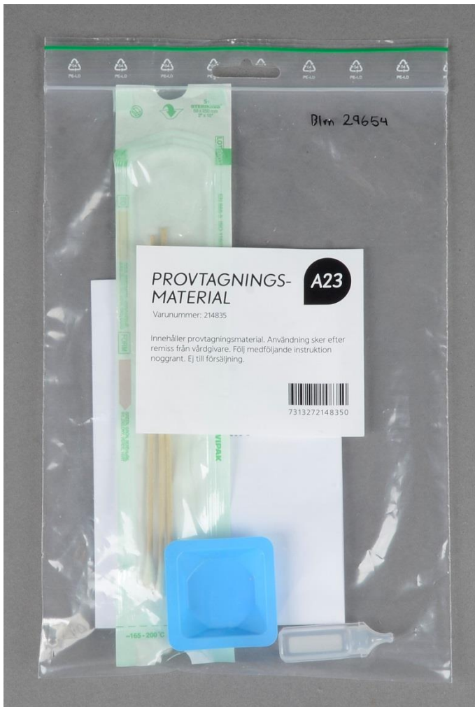
Provtagningskit, Blm 29654

Vid sidan av fotodokumentationen och enkäten samlade museet även in föremål med koppling till pandemin, tex skyddsutrustning och provtagningsmaterial.