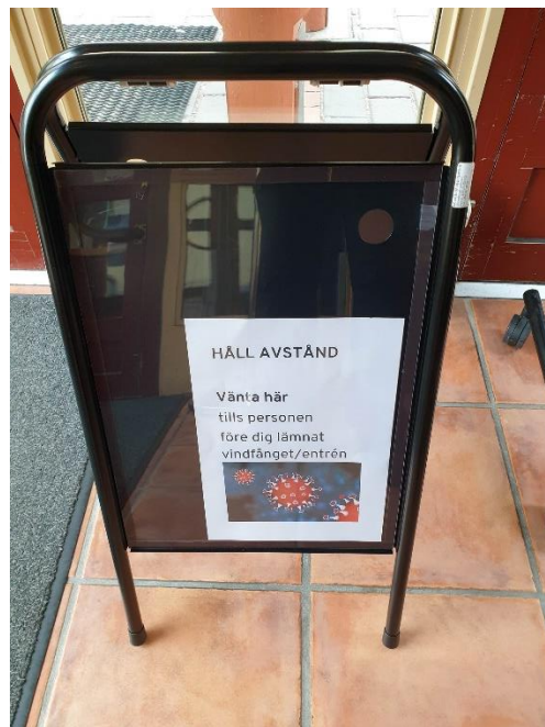
Klisterdekal, Blm 29338 Gatupratere vid Sölvesborgs bibliotek.