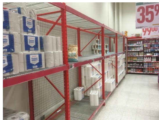
”Matinköpen begränsas pga av hamstringen”