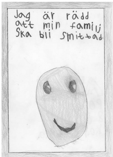
Barnteckning, elev från åk 5. Karlskrona kommun.

Barns tankar och reaktioner är i stort sett samma som de vuxnas, även om barnen uttrycker det på ett mer rättframt sätt. De är arga, ledsna, oroliga och saknar de som de inte kan träffa. Alla hör vad de vuxna pratar om och försöker förstå och tolka detta. I de korta berättelser vi samlade in från barn framgår en stark saknad över att inte kunna träffa mor – och farföräldrar samt en saknad efter idrottsaktiviteter.