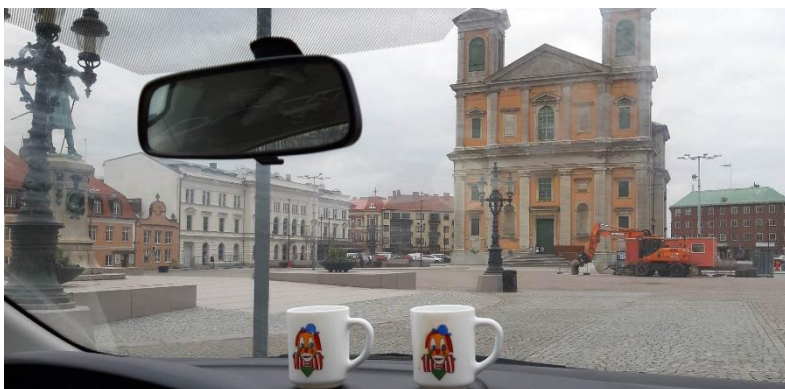
"Coronafika i bil på Stortorget i Karlskrona", Blm_Db 2020 0187.