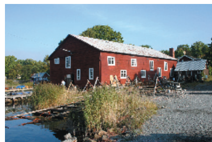
Saxemara båtvarv i Ronneby kommun.