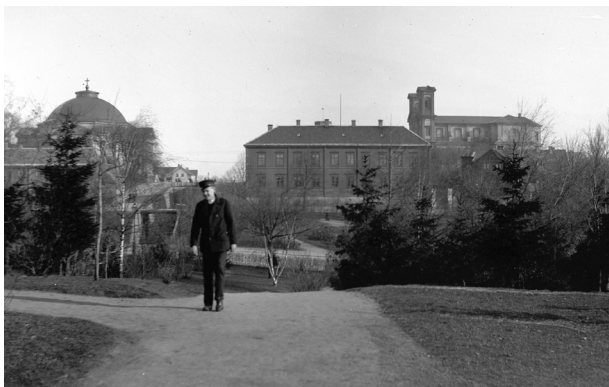
Amiralitetstorget, Karlskrona 1/4 1896.

Praktikanter från olika skolor har prövat på digitalisering och registrering samt vård av fotografiskt material. Bildarkivet har under 2006 flyttat till tillfällig arkivlokal. En förbättring av arbetsmiljön i Kulturarvs-ITs kontorsutrymme har också genomförts.