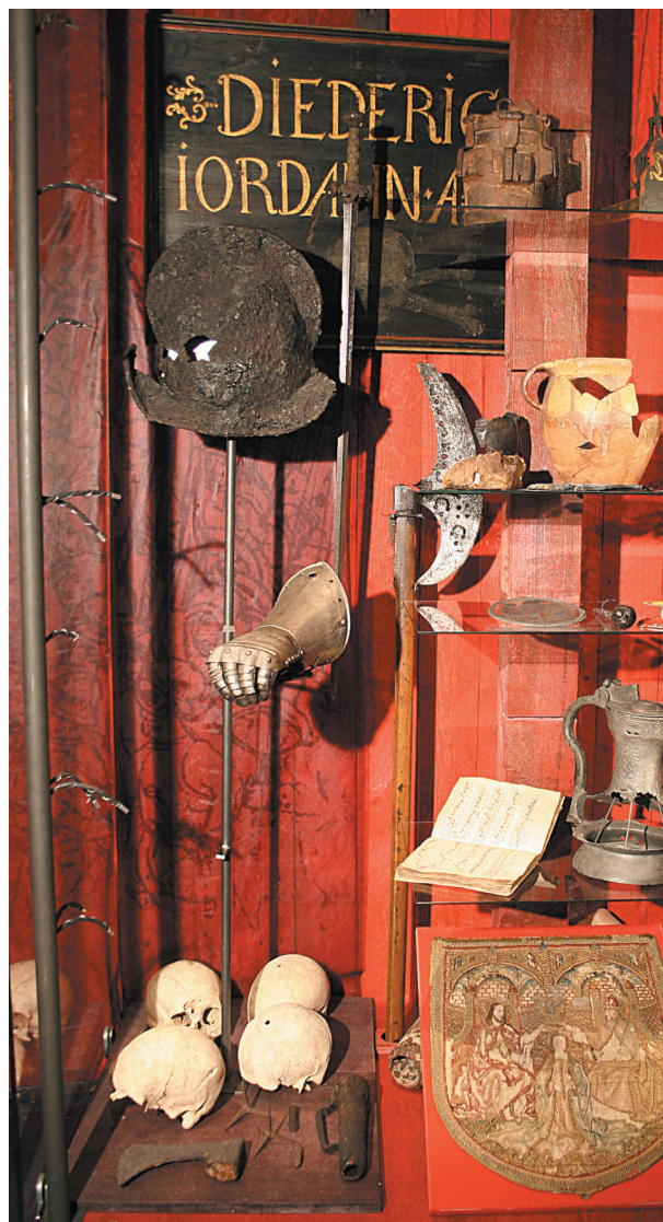
Blekinge i ett nötskal.

Föreläsningsserien "Syn på stan" arrangerades tillsammans med Karlskrona kommun.