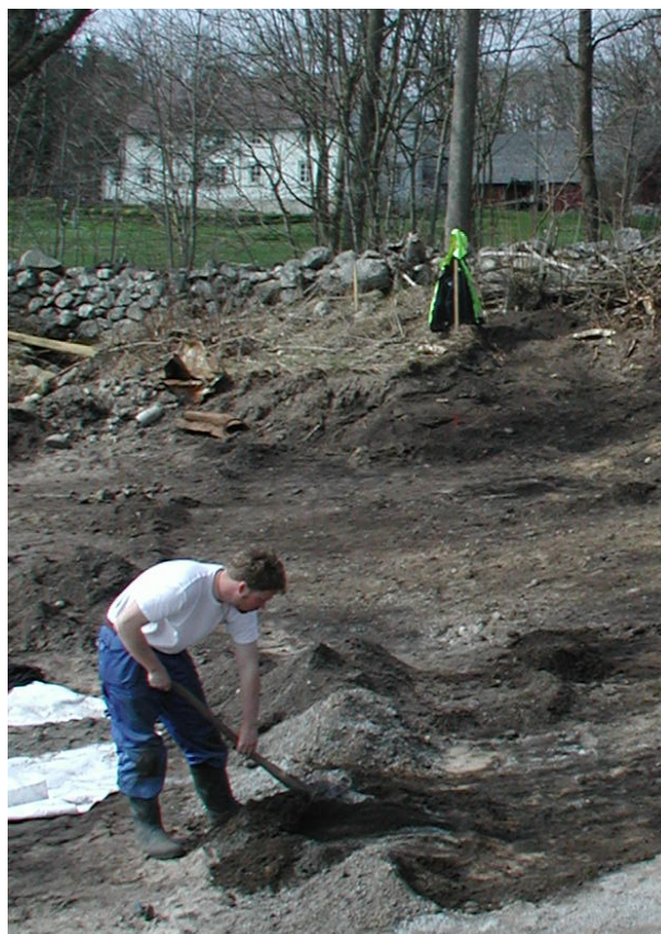
Rensningsarbete i Björkeryd.

14 undersökningsrapporter har utarbetats. Vintermånaderna har dessutom ägnats fortsatt uppordning av äldre undersökningar och dokumentation. Bland annat har på uppdrag av Riksantikvarieämbetet det omfattande fyndmaterialet från undersökningarna i Istaby i slutet av 1970-talet registrerats. Parallellt härmed har scanning av ritningar och foton påbörjats inför planerad publicering av den komplexa undersökningen. Fortsatt planering inför överflyttningen till Rosenholm har skett.