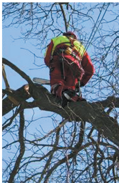
Oxeln i barock-trädgården fälldes p.g.a. svampangrepp.