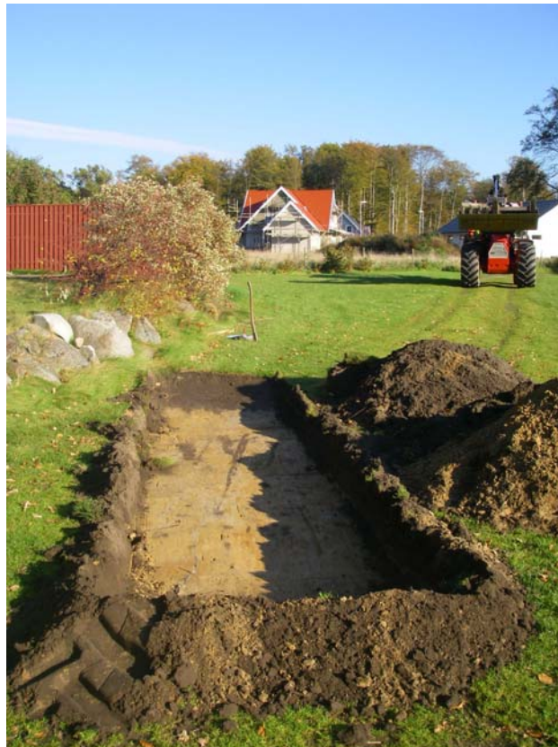
Fig.2 - Schakt 3 med tydliga plogspår. Fotografi mot NO.

Matjordslagret var överlag tunt och varierade mellan 0,25 och 0,30 m. Undantagsvis uppgick tjockleken till 0,40 m. Schaktningarna påvisade en sandig jordmån med en undergrund bestående av gul till gulbrun sand och siltig sand. Inga antikvariskt intressanta lager eller anläggningsspår framkom i samband med utredningsarbetet. Ett fåtal lösfynd i form av ett par bearbetade avslag Kristianstadflinta insamlades dock i den högre belägna delen av Schakt 1. Utöver dessa kom ett mindre avslag i Schakt 3. Det var påtagligt att marken tidigare nyttjats för odling, och då de arkeologiska spåren var så pass blygsamma, rekommenderades inga vidare antikvariska insatser inför slutlig exploatering.