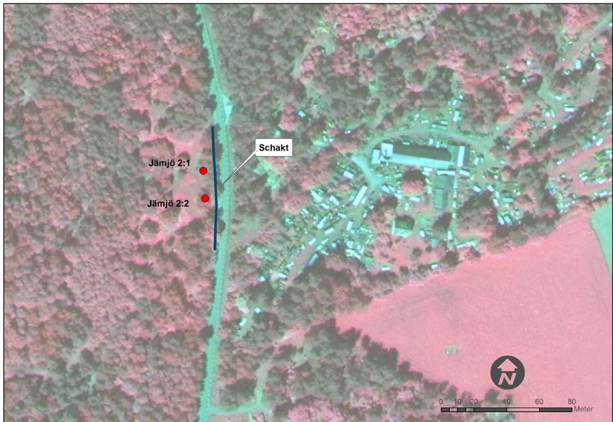
Fig. 2 Schakt markerat på Ortofoto