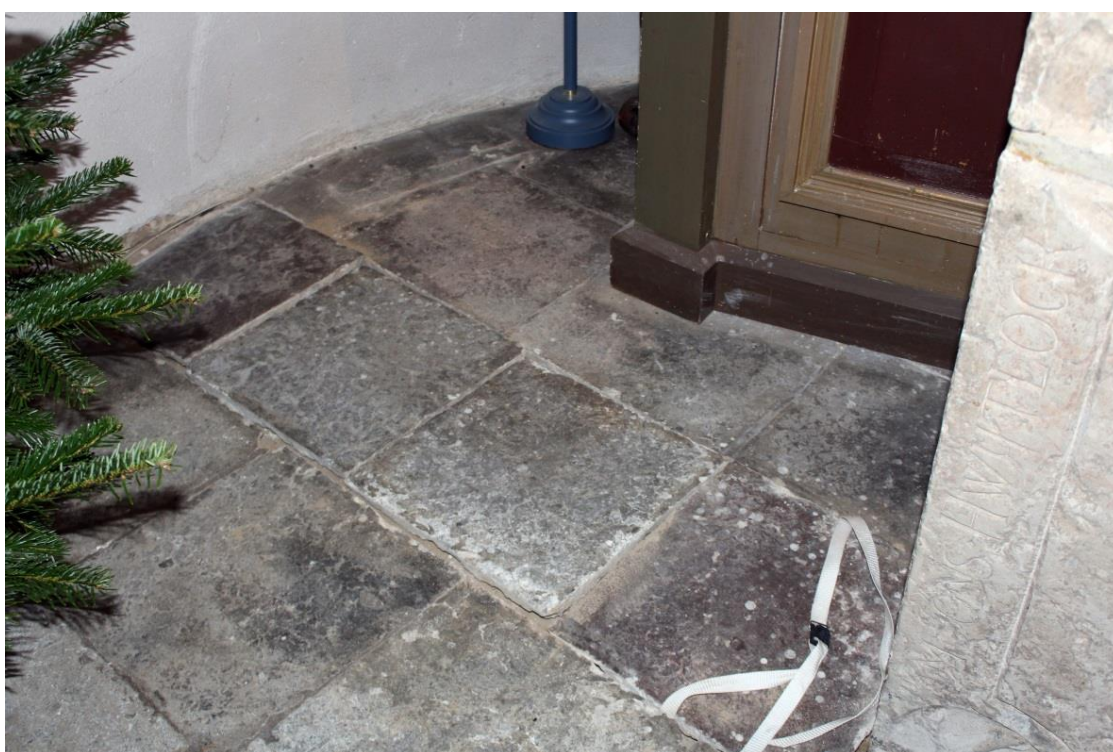
Fig.4 – Schaktytan efter återställning