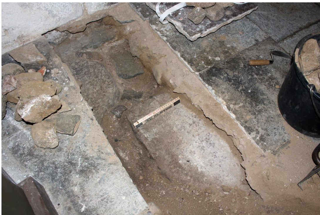
Fig.3 – Äldre golvnivå framrensad