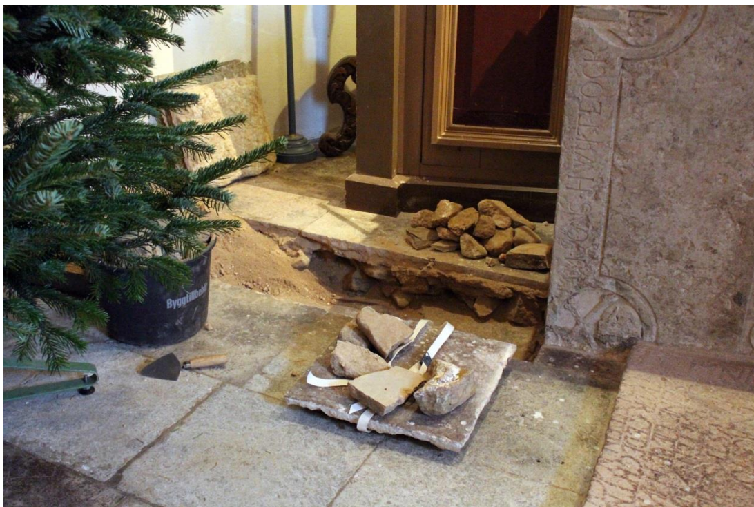
Fig.2 – Översikt provschakt direkt norr om altaret