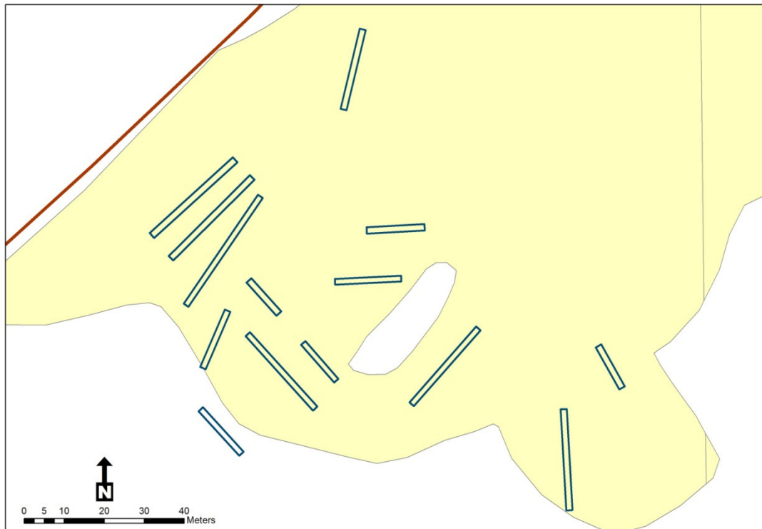
Fig 2. Schakt 1-14 markerade på Fastighetskartan