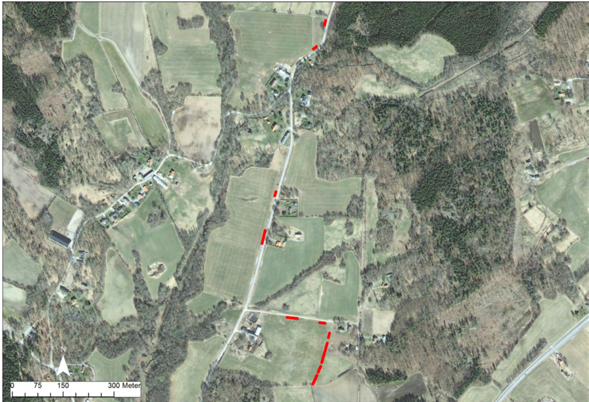
Fig. 3 Schakt markerade på Ortofoto