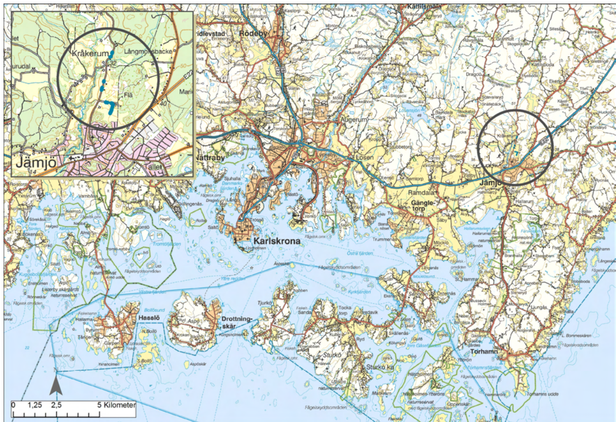
Fig. 1 Undersökningsområdet markerat på Vägkartan resp Terrängkartan