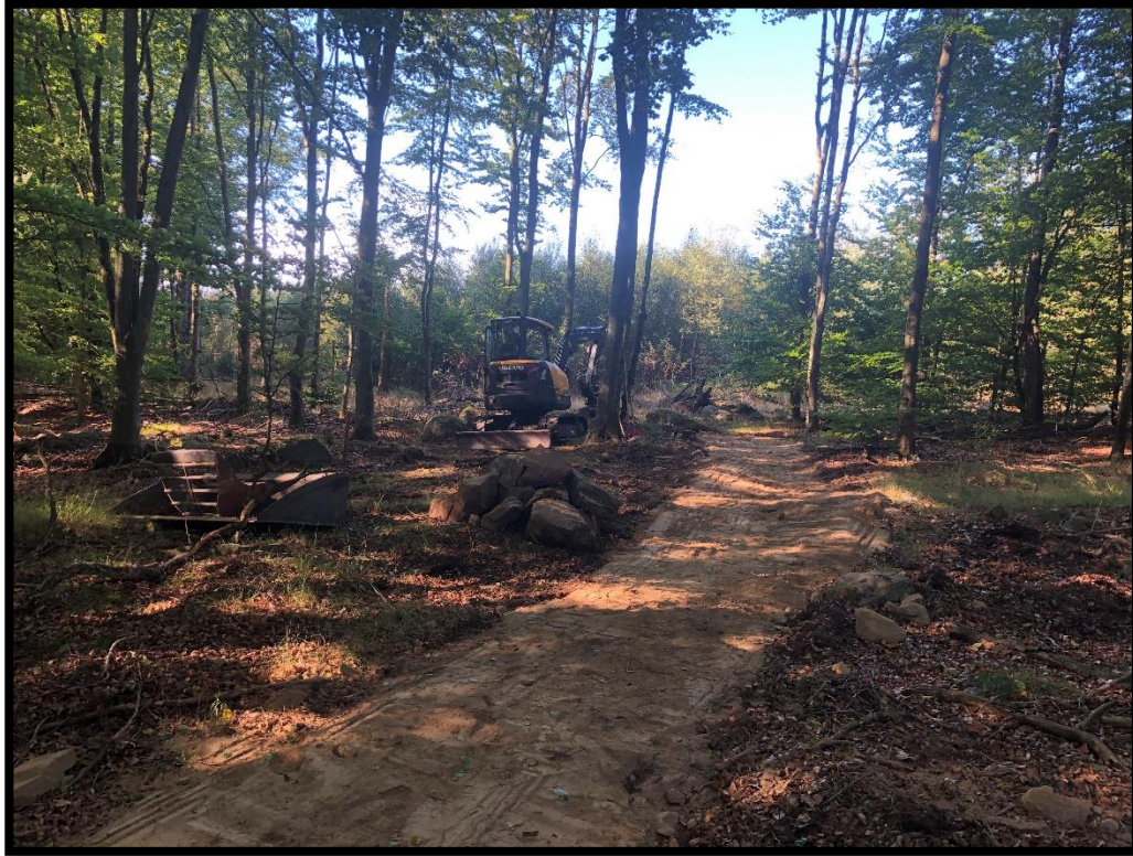
Bilaga 1b – Pågående exploateringsarbeten