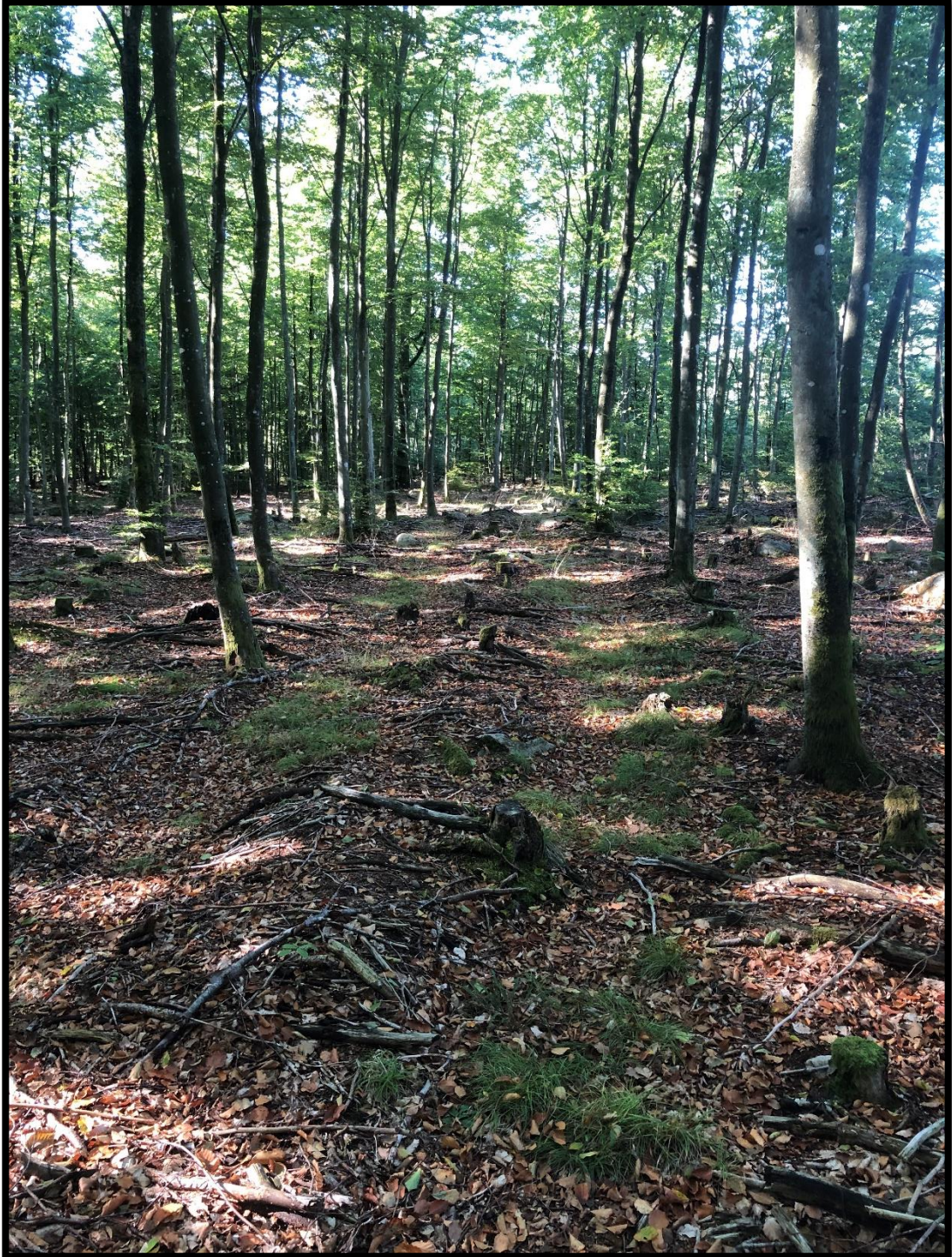
Bilaga 1a – Redan uppkörd väg för skogsmaskiner som kunde nyttjas för cykelledens sträckning