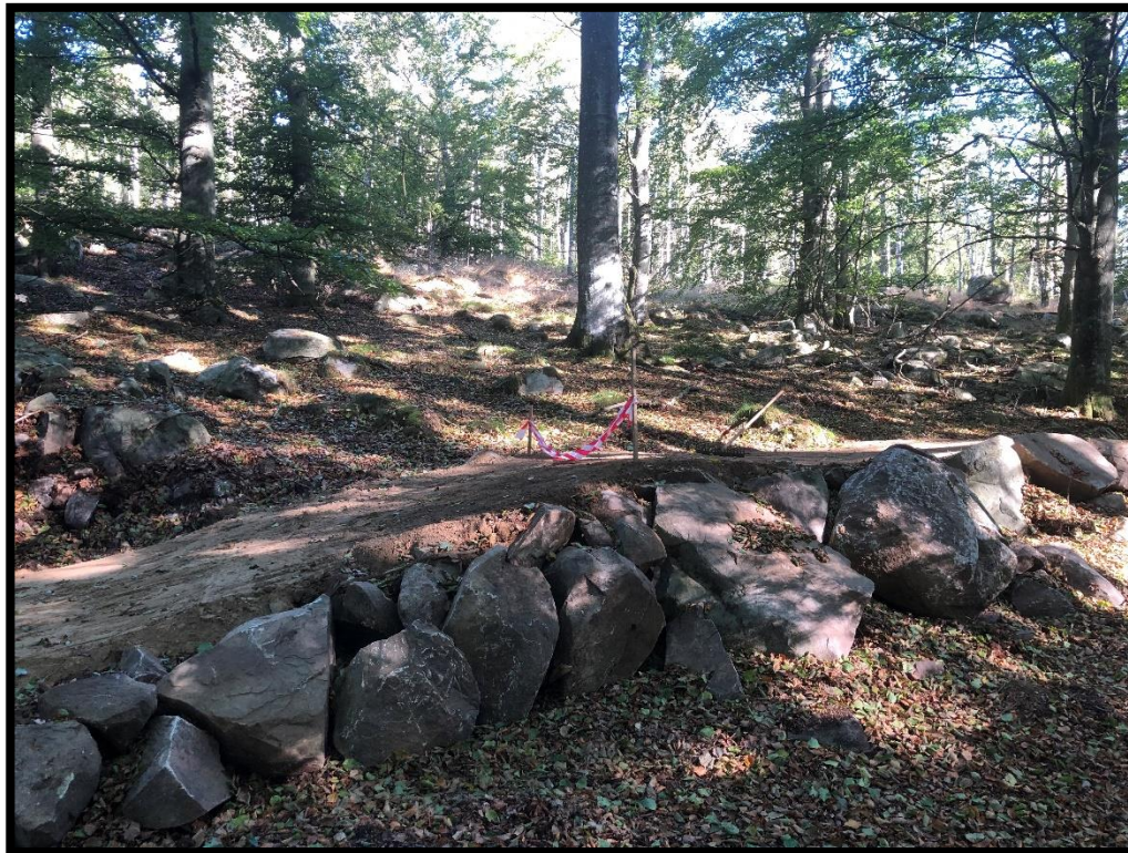
Bilaga 1c – Del av cykelleden under färdigställande