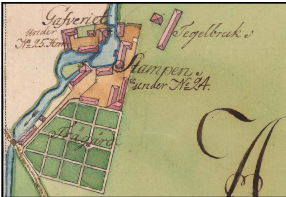
Fig.3 – Kulturmiljöer i utredningsområdets närhet enligt storskifteskarta från 1770-talet.