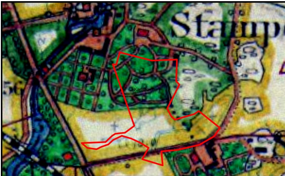
Fig.2 – Utredningsområdet markerat på Häradskartan 1915-19.

Kulturmiljön vid Mieån förefaller tidigt ha präglats av diverse industriella verksamheter. Ett tydligt exempel på en sådan är det bomullsspinneri, enligt engelsk modell, vilket anläggs under 1830-talet vid Strömman. Även i anslutning till det aktuella utredningsområdet fanns såväl omfattande fabriksmiljöer som parkanläggningar vid 1700-talets andra hälft. Under det eftermedeltida skedet samsas här, förutom diverse kvarnar, en stamp, ett garveri och ett tegelbruk (fig.2 resp 3). Inom fastigheten Frostentorp 5:5 anläggs så småningom, sannolikt under 1800-talets andra hälft, en parkanläggning vilken ännu fanns bevarad vid tiden för 1:a världskriget. Den södra delen av utredningsområdet förblir jordbruksmark långt in på 1900-talet. Under 1930-talet bebyggs sedan fastighetens norra hälft med ett hus i funkisstil, vilket rivs av kommunen under 1990-talet.