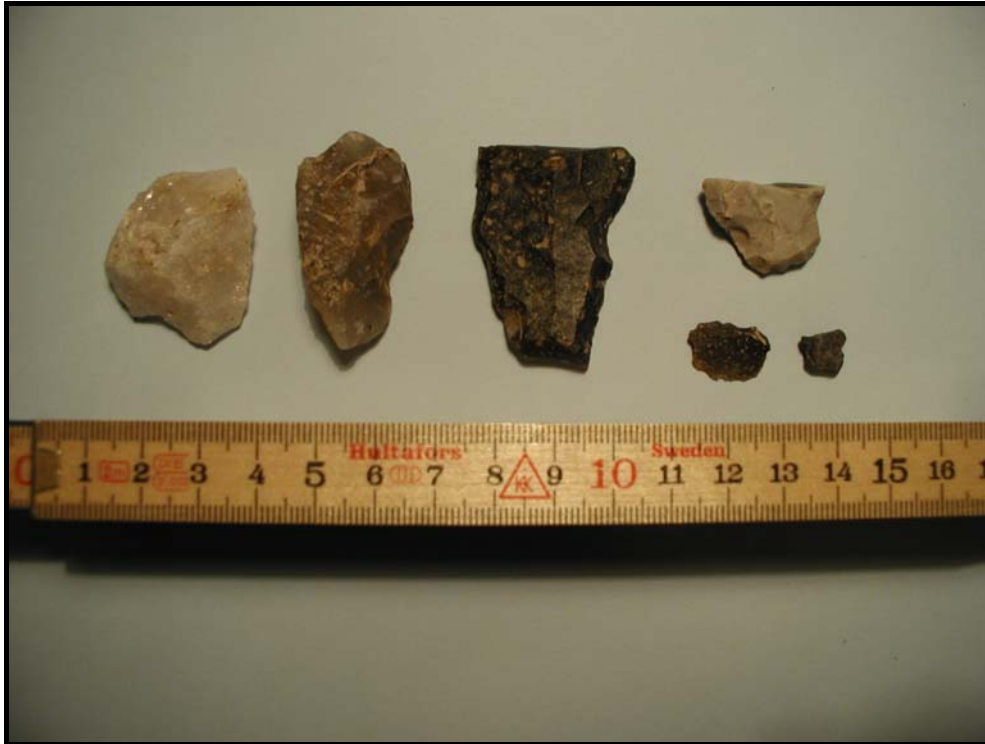
Fig.4 – Insamlat fyndmaterial Särskild utredning Frostentorp 5:5.