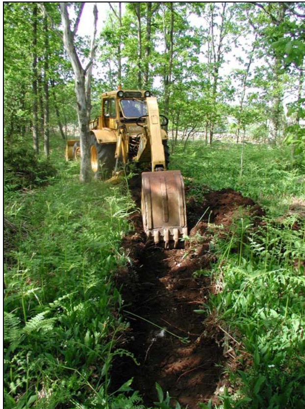
Fig.2 – Sökschakt 5 fotograferat mot V.

Utökningen av detaljplanen avsåg fem nya fastigheter fördelade på tre punkter inom utredningsområdet. De planerade tomterna låg i huvudsak i platäläget, uppe på höjdens västra sida. Undantag var tomterna längst i N, vilka planerats i den mjuka sluttningen ner mot dalgången i väster. Den särskilda utredningen genomfördes i form av sökschaktning med grävmaskin på antikvariskt lovande lägen i terrängen. Sammanlagt drogs sju 0,7 m breda schakt med en sammanlagd längd på omkring 75 löpmeter inom området (se bilaga 1). I samband med detta förfarande fotodokumenterades utredningsområdet och fynd av arkeologiskt intresse tillvaratogs.