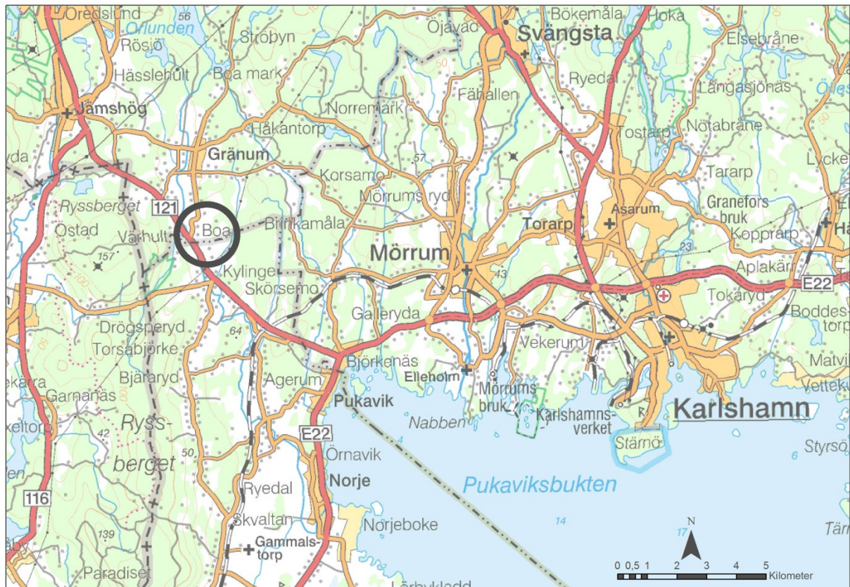
Fig. 1 Utredningsområdet markerat på Översiktskartan