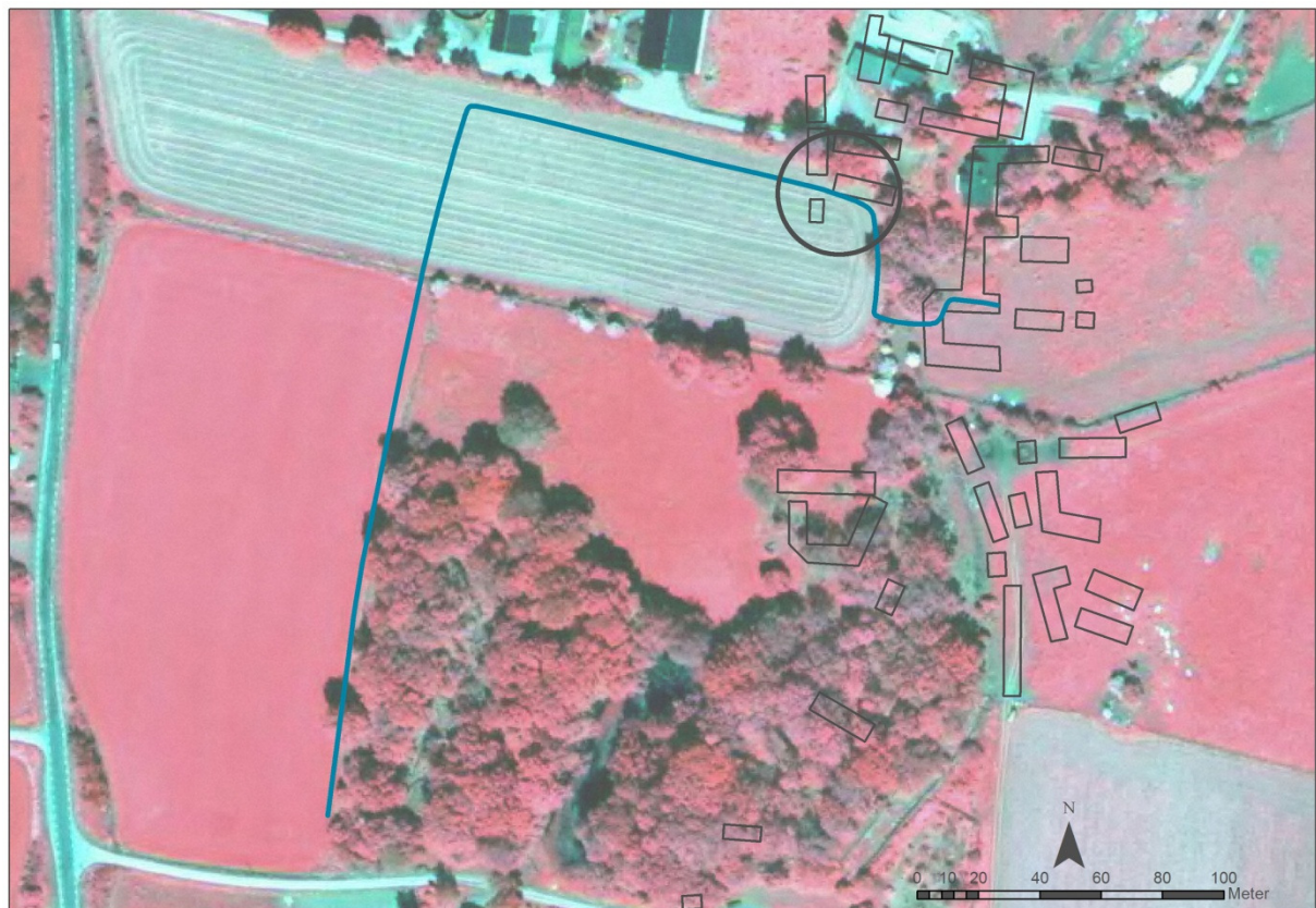
Fig. 2 Schakt för kabelförläggning samt byggnader enligt enskifteskartan 1815 markerade på Fastighetskartan