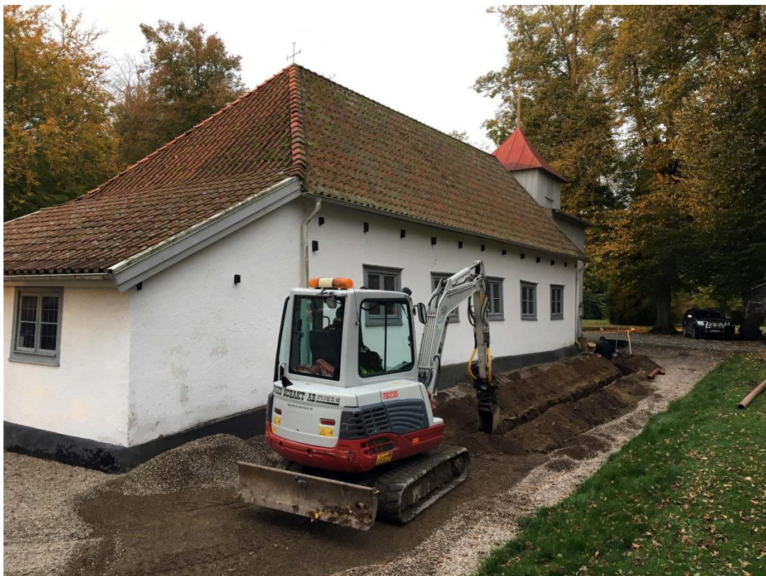
Fig.2 – Schaktning norr om kyrkan, översikt mot sydväst.