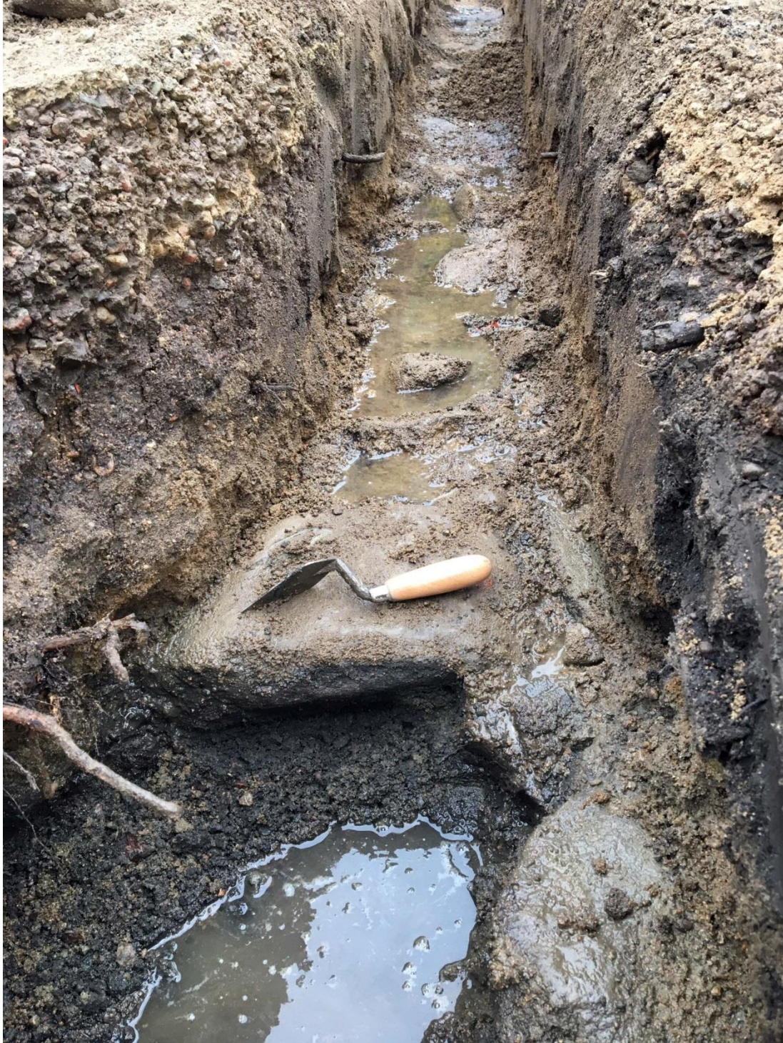
Fig.3 – Parti av framrensad stenläggning öster om kyrkan.