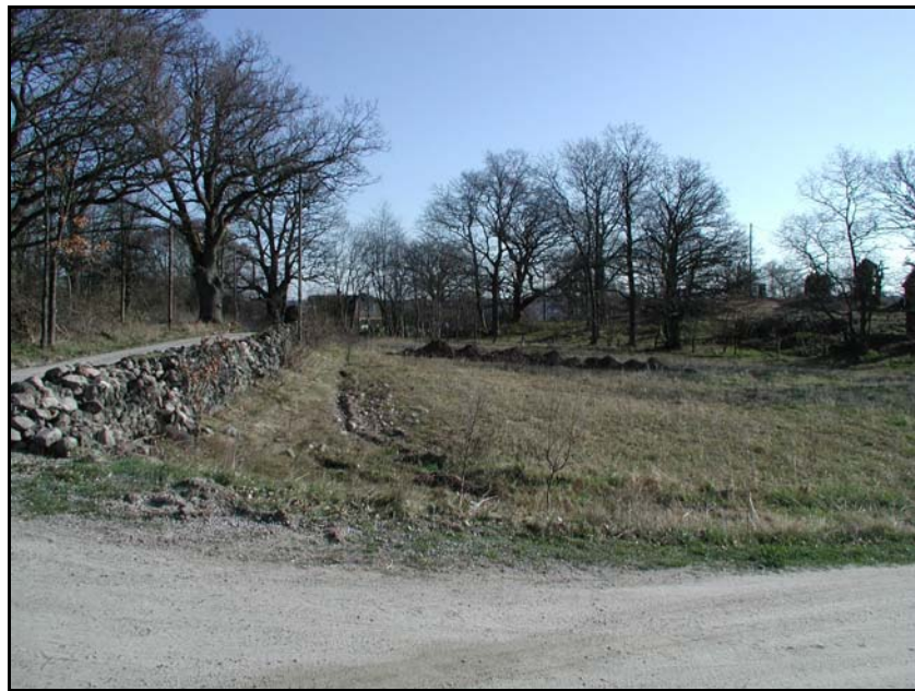
Fig.5 – Alternativ tomtplacering fotograferad mot N. I bakgrunden sökschakt 1.

Det agrarhistoriska landskapets närmast statiska utformning på Torkö kan tydligt följas genom studier av såväl ett äldre kartmaterial som dagens, synliga fysiska spår. De två ursprungliga stamfastigheterna på Torkö har dock genomgått ganska kraftiga förändringar under 1900-talets senare del, och de senast anlagda tomterna har etablerats i anslutning till det befintliga vägstråket. I enlighet med tidigare utlåtanden är det fortsatt Blekinge museums mening att det ur kulturmiljösynpunkt är möjligt med viss nyetablering av bostadshus på Torkö. Med syfte att inte splittra och förstöra de agrara kulturmiljöerna genom exponerad nyetablering i norr är det dock av stor vikt att den redan påbörjade processen med förtätning av befintlig bebyggelse fortsätter. De föreslagna alternativa tomterna bör därför bebyggas och även fortsättningsvis kompletteras genom nyetablering främst i lucktomter.