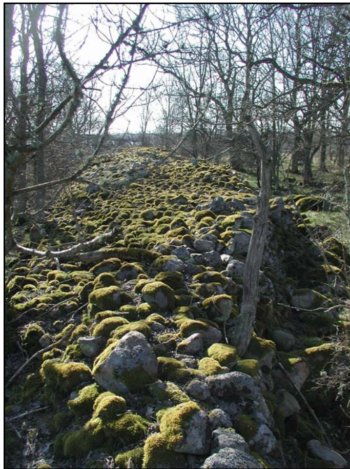
Fig.4 – Omfattande äldre odlingsröse inom Delområde 3.

Delområde 3 utgörs till del av halvöppen och förbuskad betesmark, vilken i N och S övergår i lövskogsbevuxna miljöer, dominerade av björk. Fossil åkermark N om det föreslagna planområdet inbegriper omfattande partier av ålderdomlig röjningssten, åkerhak och terrasskanter.