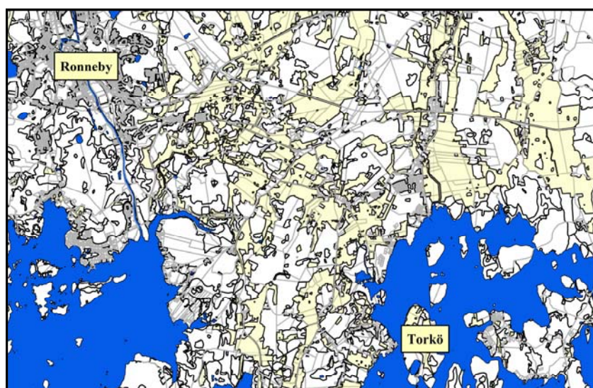
Fig.1 – Torkö i förhållande till Ronneby tätort.

Som en del av det pågående detaljplanearbetet för del av fastigheterna Torkö 1:2 och 1:3 beställde Ronneby kommun vintern 2005 en särskild arkeologisk utredning av Blekinge museum. Efter att beslut tagits av länsstyrelsen (Dnr 431-6604-04) genomförde Länsmuseet det arkeologiska fältarbetet under tidig vår 2005. Föreliggande rapport redovisar de framkomna resultaten från detta arbete, och den avses utgöra ett antikvariskt underlag för ärendets fortsatta hantering.