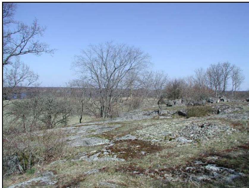
Fig.3 - Hållmark inom Delområde 1, fotograferad mot N.

I samband med den särskilda utredningens inventeringsarbete framgick det att utredningsområdet grovt kunde indelas i fyra olika delområden med hänsyn till topografi och nutida markanvändning (bilaga 1). Delområde 1 är delvis bevuxet med ekblandskog, men inbegriper även omfattande partier hållmark. Området nyttjas idag i sin helhet som hagmark.