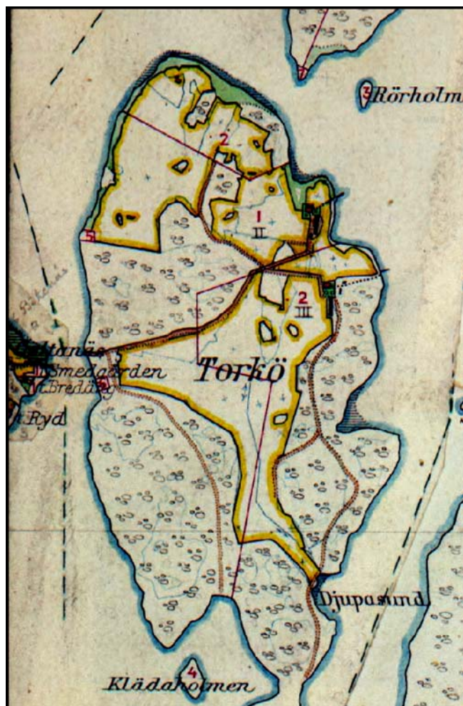
Fig.2 – Torkös kulturmiljöer under 1910-talet