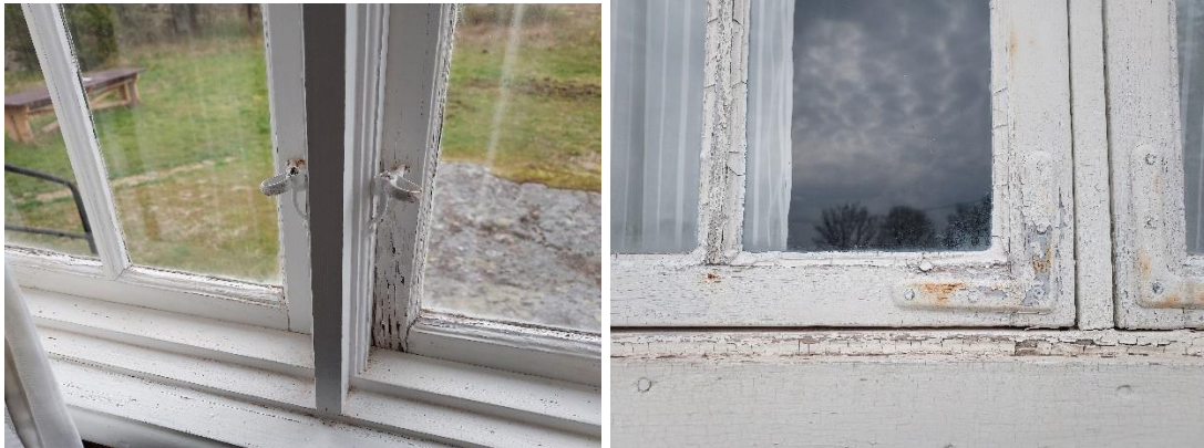
Fig. 1 (t.v.). Representativ skadebild invändigt: flagad färg och rostgenomslag. Fig. 2 (t.h.). Representativ skadebild utvändigt: flagad färg på bågar och hörnjärn, rostgenomslag, sprucket fönsterkitt. Notera att hörnjärnen är fästa med stjärnskruv.