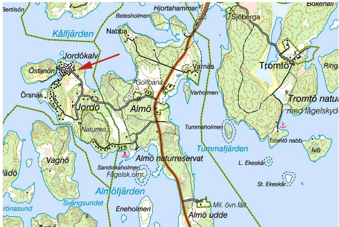
Del av Förkärla socken, missionshuset markerat.