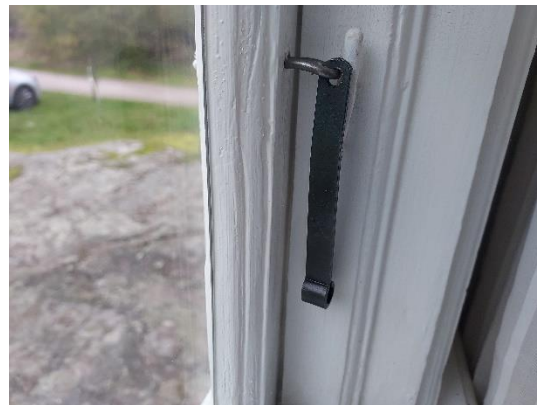
Fig. 6. Linoljebränt stormjärn.