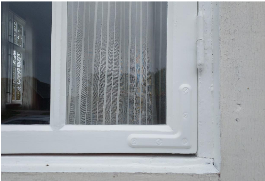
Fig. 4. Detalj på fönster efter arbetet. Jämför med fig. 2.