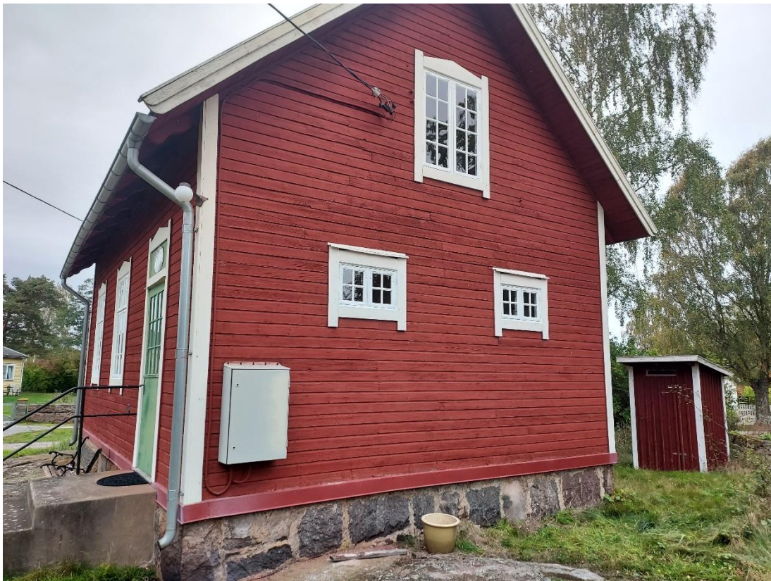
Fig. 7. Östra gaveln efter arbetet.

Fönsterkarmarna rengjordes med målartvätt (Målningstvätt JAPE) och skrapades därefter rena från löst sittande/krackelerad färg (på yttersidan och insidan fram till fönsterbågarnas slagkant). Målning skedde likt fönsterbågarna i tre olika omgångar. Inga tätlistor monterades eftersom sådana inte fanns tidigare.