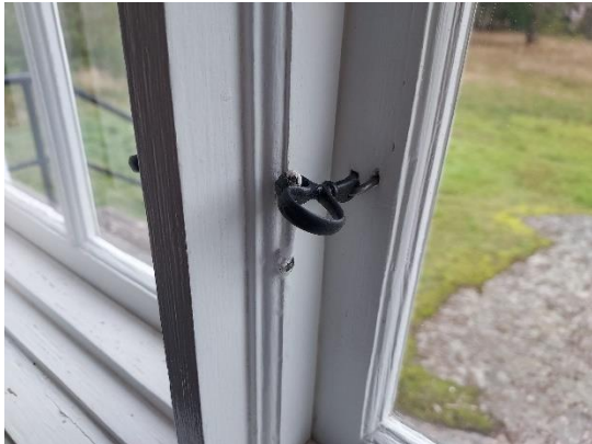
Fig. 5. Linoljebränd fönsterhasp.