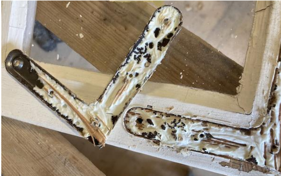
Fig. 3. Hörnjärn med silikon. Notera hur silikonet etsat sig fast i träet, vilket medfört träskador i samband med borttagningen av järnet. Foto Michel Lindsjö, 2023.