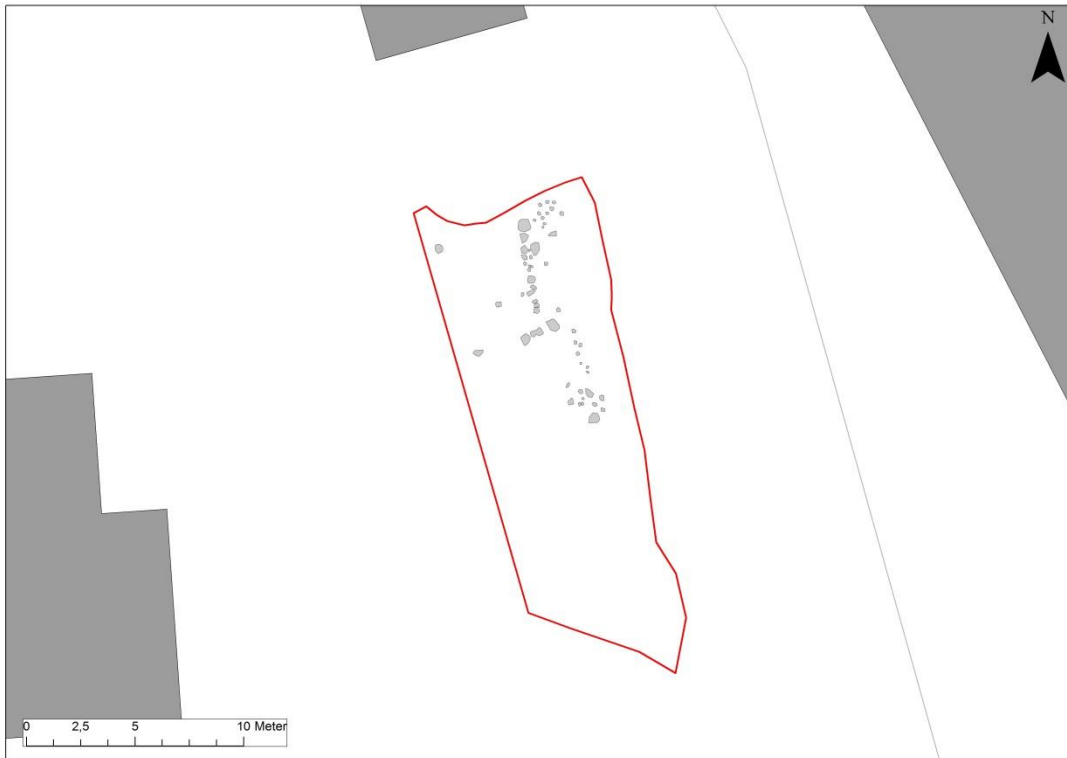
Fig.2 – Detalj av exploateringsområdet med inmätta stenar.