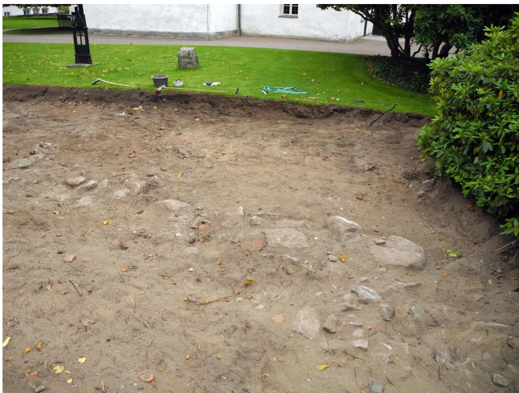
Fig.4 – Detalj av exploateringsområdet mot väster.