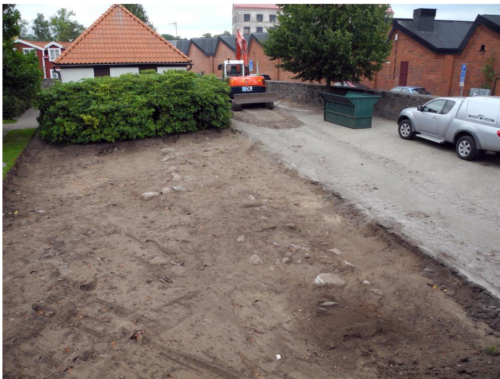
Fig.3 – Exploateringsområdet mot norr.