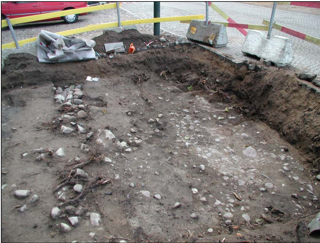
Fig.3 – Schakt 3 mot SSV. Äldre, stenlagd gatunivå i bildens högra del.

I schakten 1-2 resp 5-8 följdes omrörda och påförda, sentida lagerstrukturer överlag av en orörd undergrund på mellan 0,5 och 1,0 m djup. Schakten var generellt kraftigt störda av diverse rör och ledningar. Inga antikvariskt intressanta observationer gjordes eller fynd insamlades i samband med grävning av nämnda schakt. Inom delar av schakten 3 resp 4 framkom stenlagda ytor bestående av 0,05 till 0,15 m stora naturstenar, omkring 0,8 m under modern gatunivå. Ytorna tolkades utgöra rester av den äldsta, stenlagda Drottninggatan. I samband med framschaktningen påträffades även vissa stenstrukturer, vilka inledningsvis tolkades som möjliga byggnadsrester. Dessa arbetshypoteser övergavs dock efter hand, då de visade sig utgöra äldre, grävda ledningsschakt från 1900-talet.