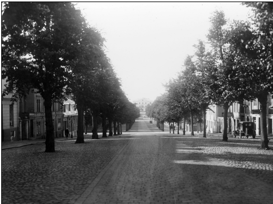
Fig.2 – Aktuellt parti av Drottninggatan mot S. under,1930-talet.

Inledningsvis avverkade kommunen planenligt sammanlagt åtta träd, placerade på bägge sidor av Drottninggatan i dess sträckning mellan Ronnebygatan och Kyrkogatan (se bilaga 1 resp. fig. 1 ). Härefter schaktades den yttäckande kullerstenen bort och de kvarstående stubbarna drogs upp. Vid det faktiska grävningsarbetet schaktades sedan samtliga gropar med en yta om ca 35 m 2 till omkring 1,5 m djup. I den mån det ansågs motiverat handrensade Blekinge museums arkeolog vissa antikvariskt intressanta lagerstrukturer. Arbetet inom ramen för den särskilda undersökningen inriktades slutligen i sin helhet på vidare dokumentation och därefter bortgrävning av framkomna strukturer i schakten 3 resp 4 (se bilaga 1 resp. fig. 3). Samtliga arbetsmoment i samband med de antikvariska insatserna dokumenterades med digitalkamera och begränsa. Karlskrona kommun bistod Blekinge museum med digitala inmätningar under slutundersökningen, och efterbearbetning av inhämtade fältdata skede slutligen i datorprogrammet ArcGIS 9.1. Samtliga fynd från förundersökningen sammanfördes med de från slutundersökningen, och de har i Blekinge museums accessionskatalog fått beteckningen BIM 26423.