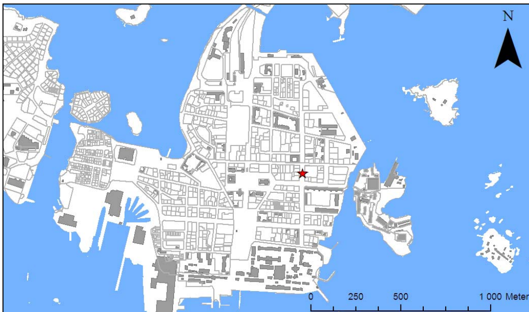
Fig.1 – Undersökningsområdets placering på Trossö, markerat med en stjärna.

Under hösten 2006 meddelade Karlskrona kommun att man under innevarande år och fram till 2008 avsåg att byta ut ett större antal träd i Trossös gatumiljö, i första hand på Drottninggatan (fig.1). Då det fanns risk att grävningsarbeten kunde komma att beröra orörda delar av fornlämningen RAÄ 77 beslutade länsstyrelsen att markingreppen skulle föregås av en arkeologisk förundersökning. Undersökningssuppletet gavs till Blekinge museum, och arbetet utfördes mellan 2006-11-02 och 2006-11-07. Av de kontexter som framkommit i samband med förundersökningsfasen, bedömdes lämningarna vara av sådan komplexitet, att det fanns behov av en kompletterande, särskild undersökning (Lst Dnr: 431-6975-06). Även detta arbete, vilket varade mellan 2006-11-08 och 2006-11-14, utfördes av Blekinge museums arkeolog och föreliggande avrapportering inbegriper såväl arkeologisk förundersökning som särskild undersökning.