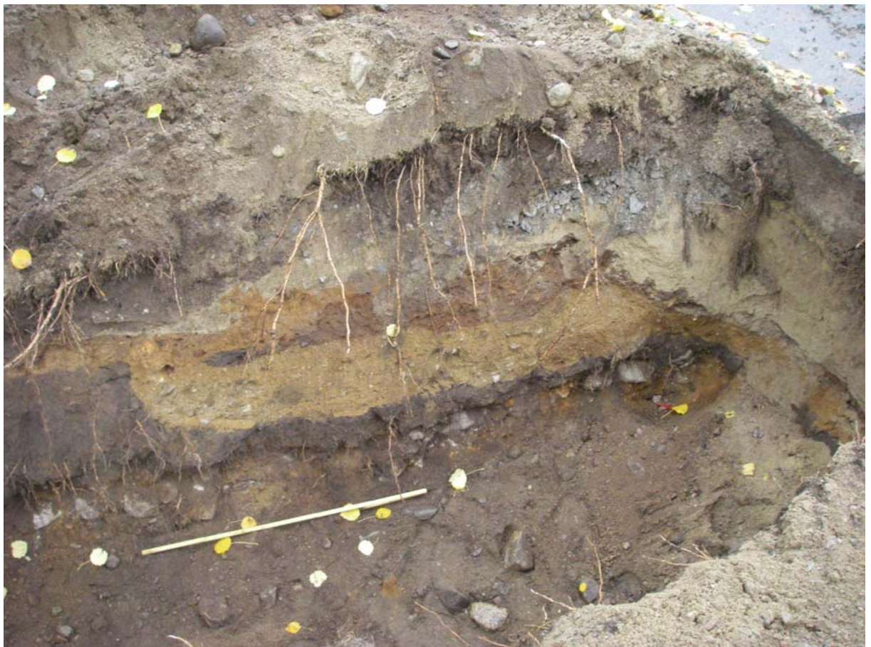
Äldre, stenlagd markhorisont i övergången mot Klostergatan.