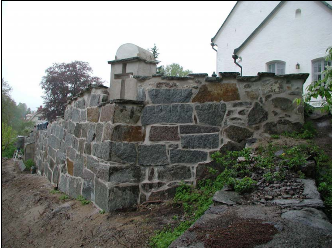
Bilaga 1j – Färdig renovering av gravmonumentets baksida.