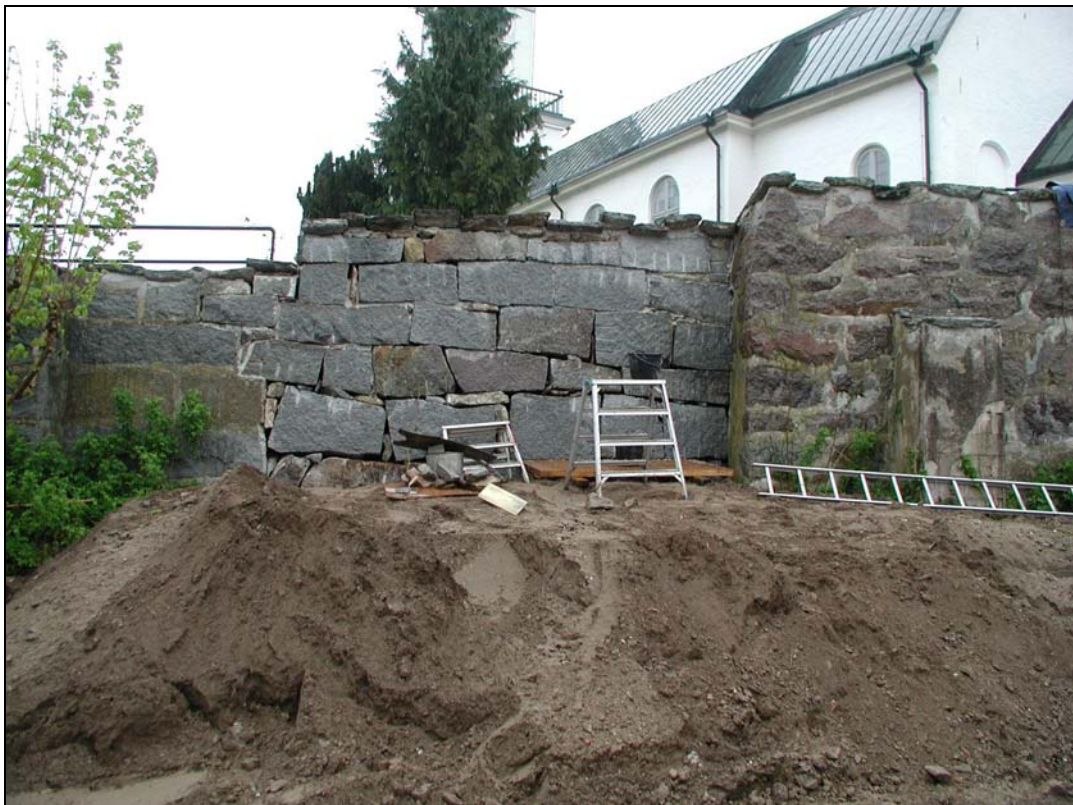
Bilaga 1i – Renoverad del av kyrkogårdsmuren.