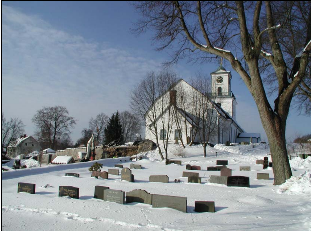
Bilaga 1c – Påbörjad rasing av mur.