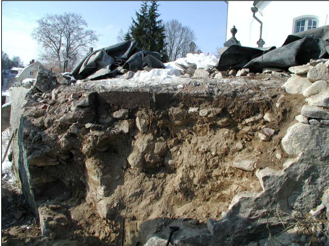
Bilaga 1e – Genomförd nedplockning av mur.