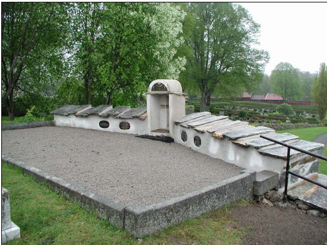
Bilaga 1k – Fullföljd renovering av gravmonuments framsida.