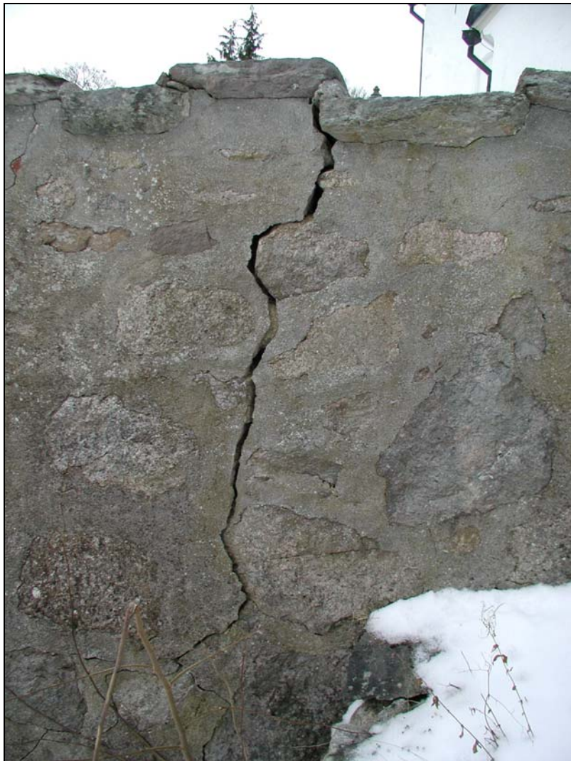
Fig.2 – Spricka i utsidan av kyrkogårdsmur öster om Jämshögs kyrka.