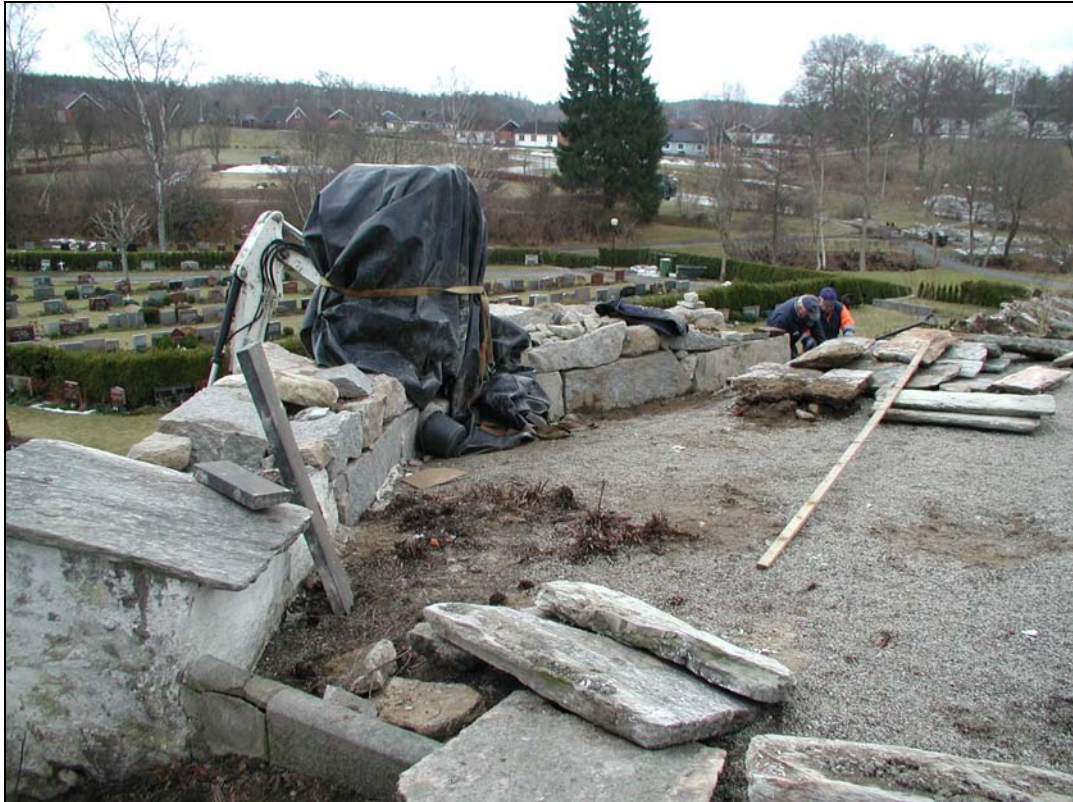
Bilaga 1h– Pågående rekonstruktion av gravmonument.