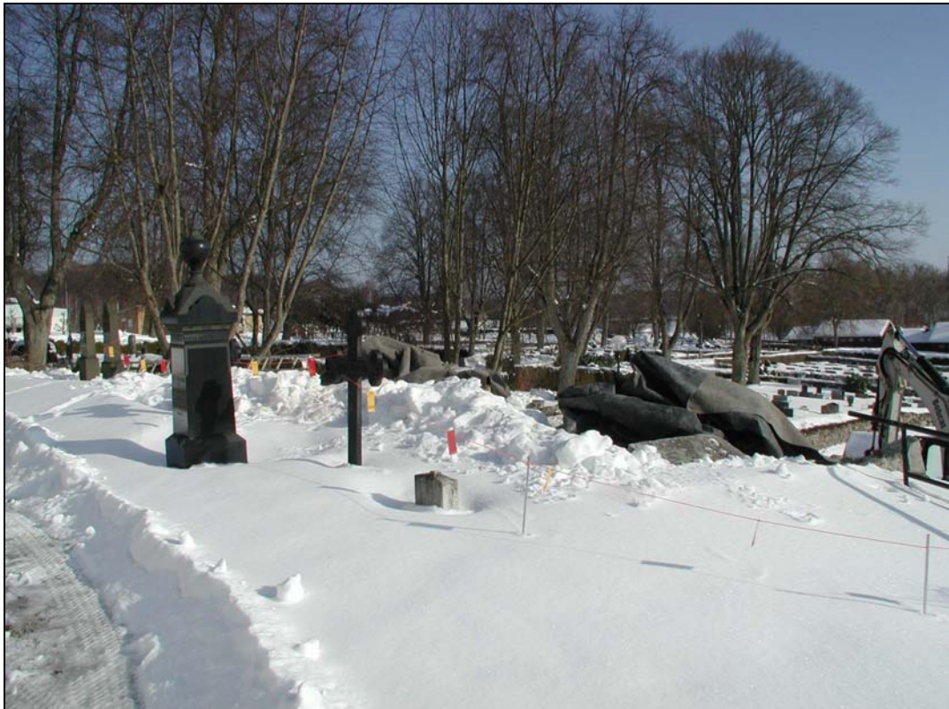
Bilaga 1d – Isärtaget gravmonument.