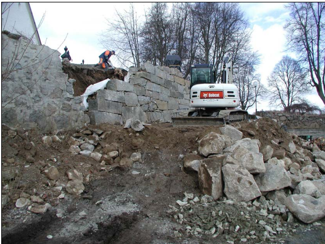
Bilaga 1f – Nyuppförd mur.