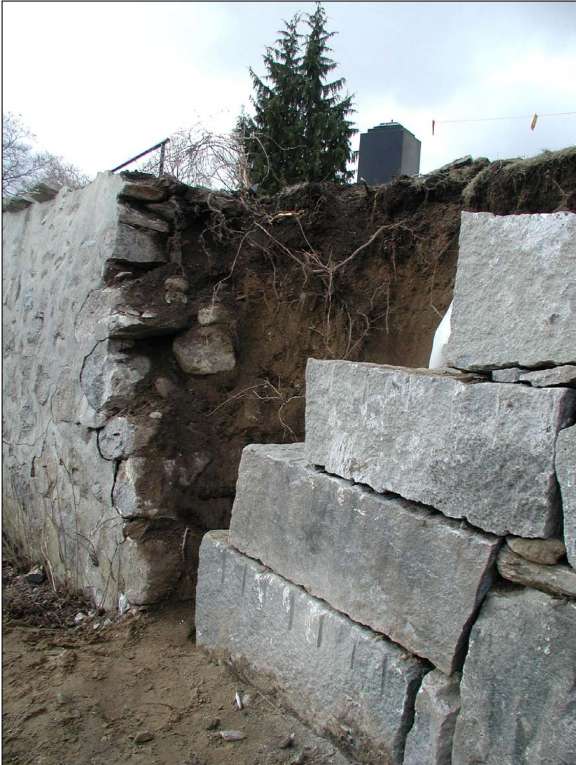
Bilaga 1g – Till vänster gammal och till höger ny mur.