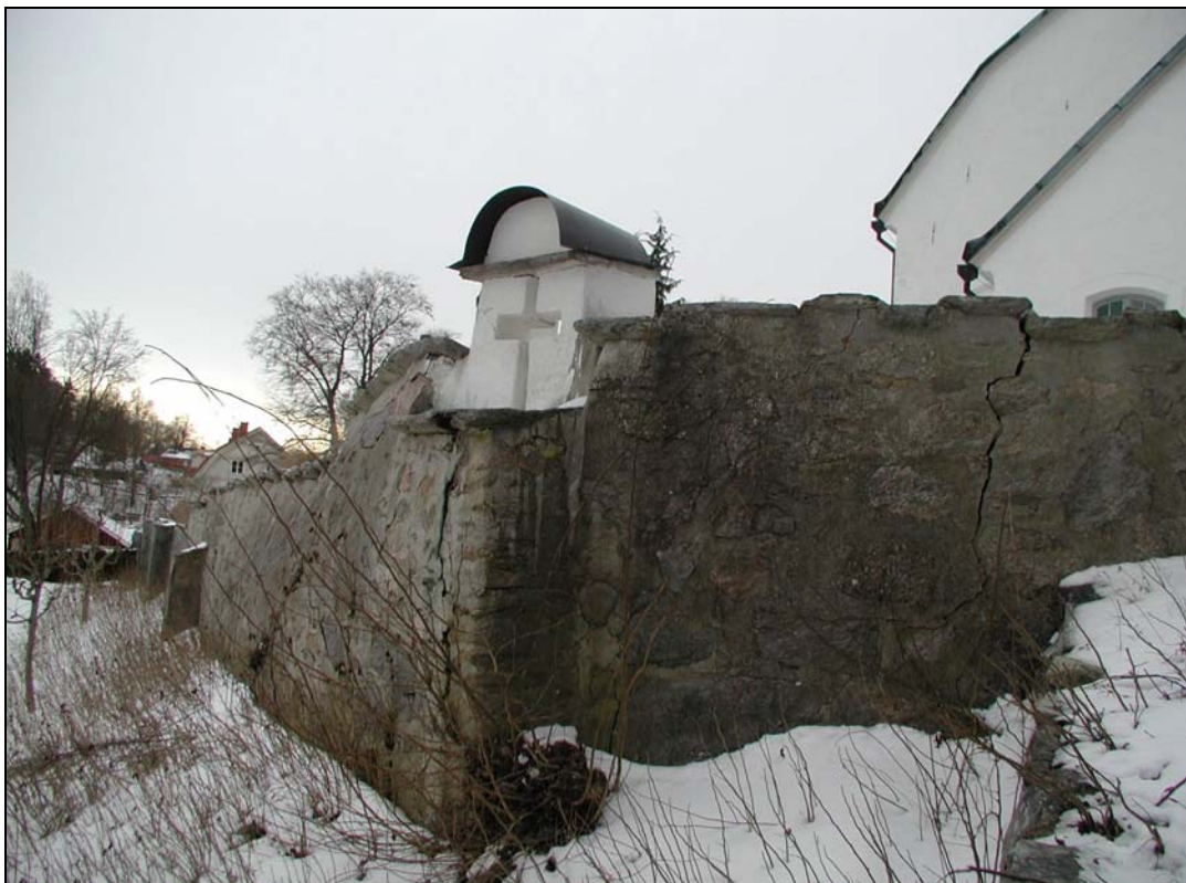
Bilaga 1b – Utsidan av prosten Hammars gravmonument innan renovering.