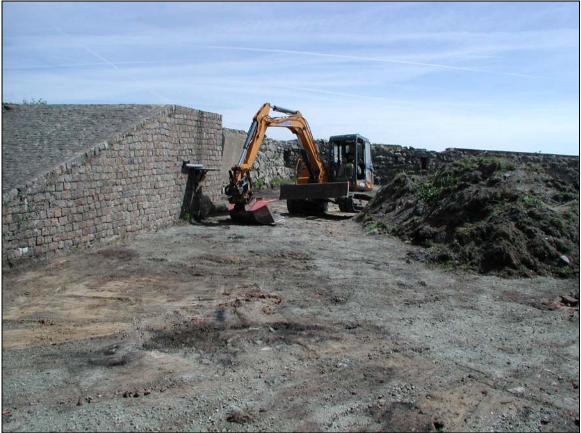
Schaktningsarbeten inom Arsenalen, överblick mot Ö.