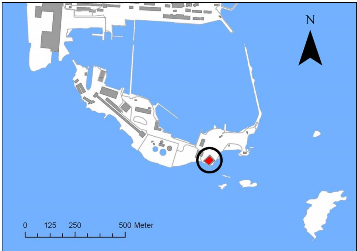
Undersökningsområdet markerat på fastighetskartan.