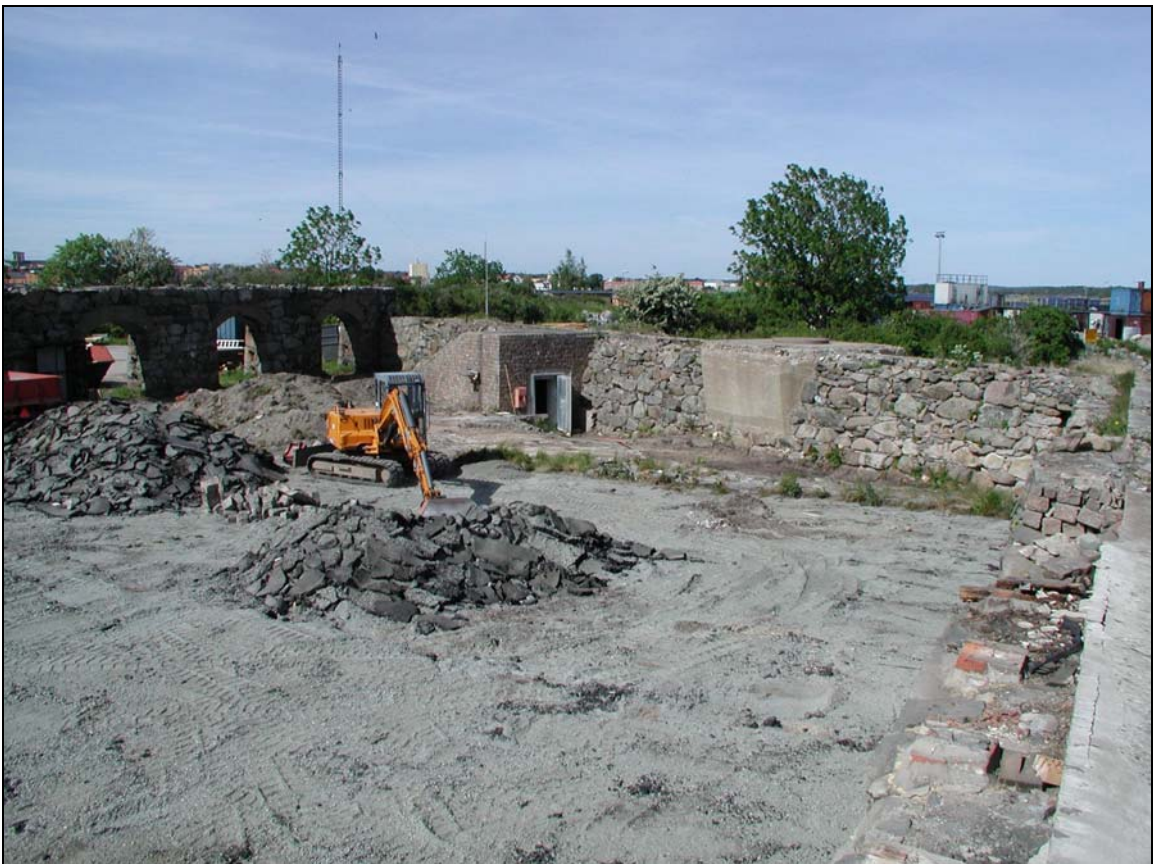
Schaktningsarbeten inom Arsenalen, överblick mot N.