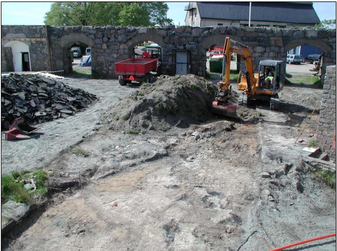
Schaktningsarbeten inom Arsenalen, överblick mot NV.