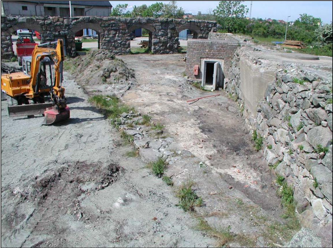
Schaktningsarbeten inom Arsenalen, överblick mot NNV.