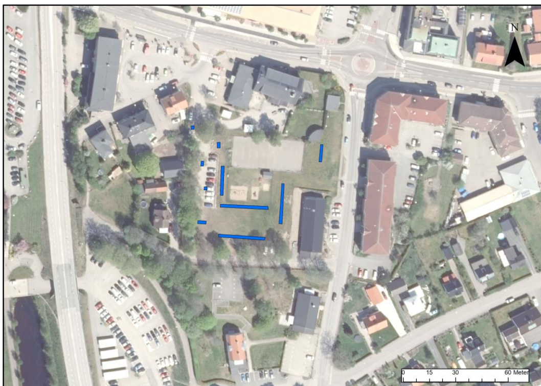
Fig. 1 – Schaktplan Gamla Torget, Holje 2018-05-24.