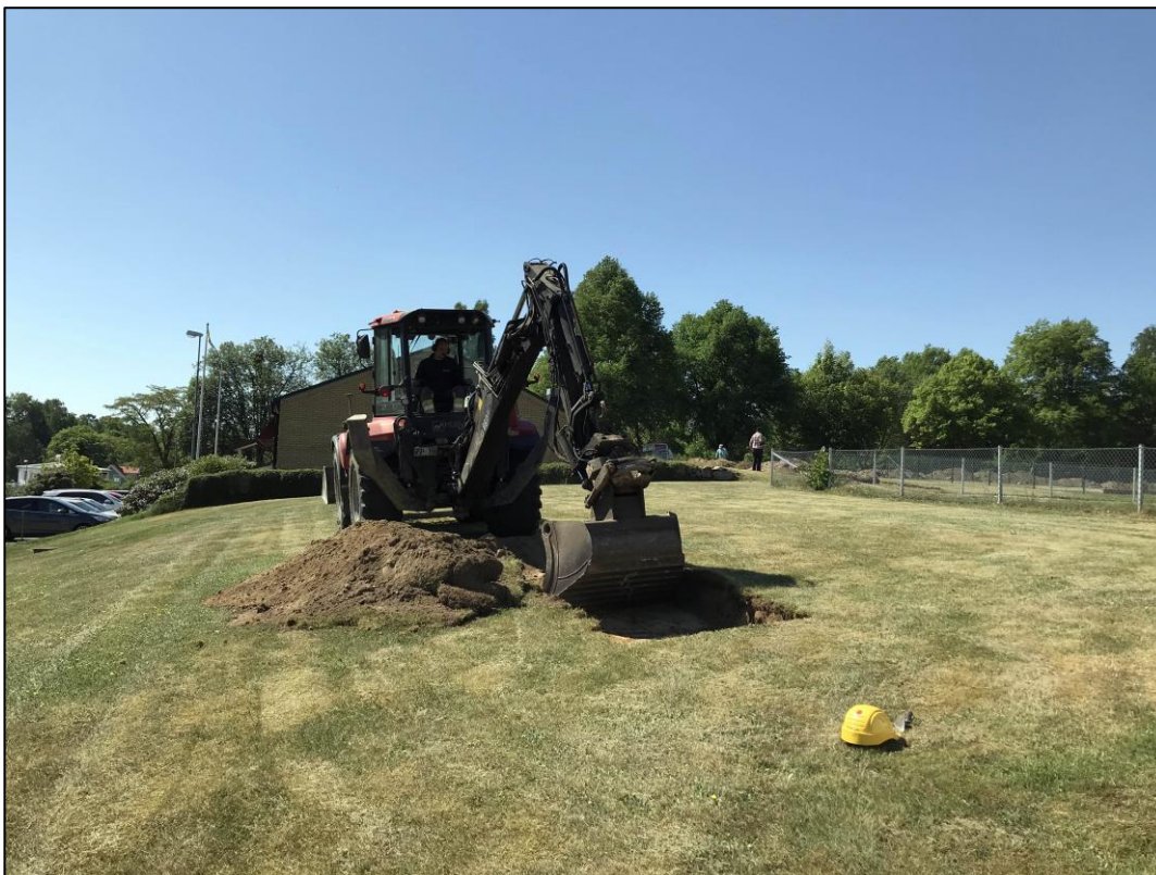
Fig.4 – Nordöstra delen av UO mot söder.