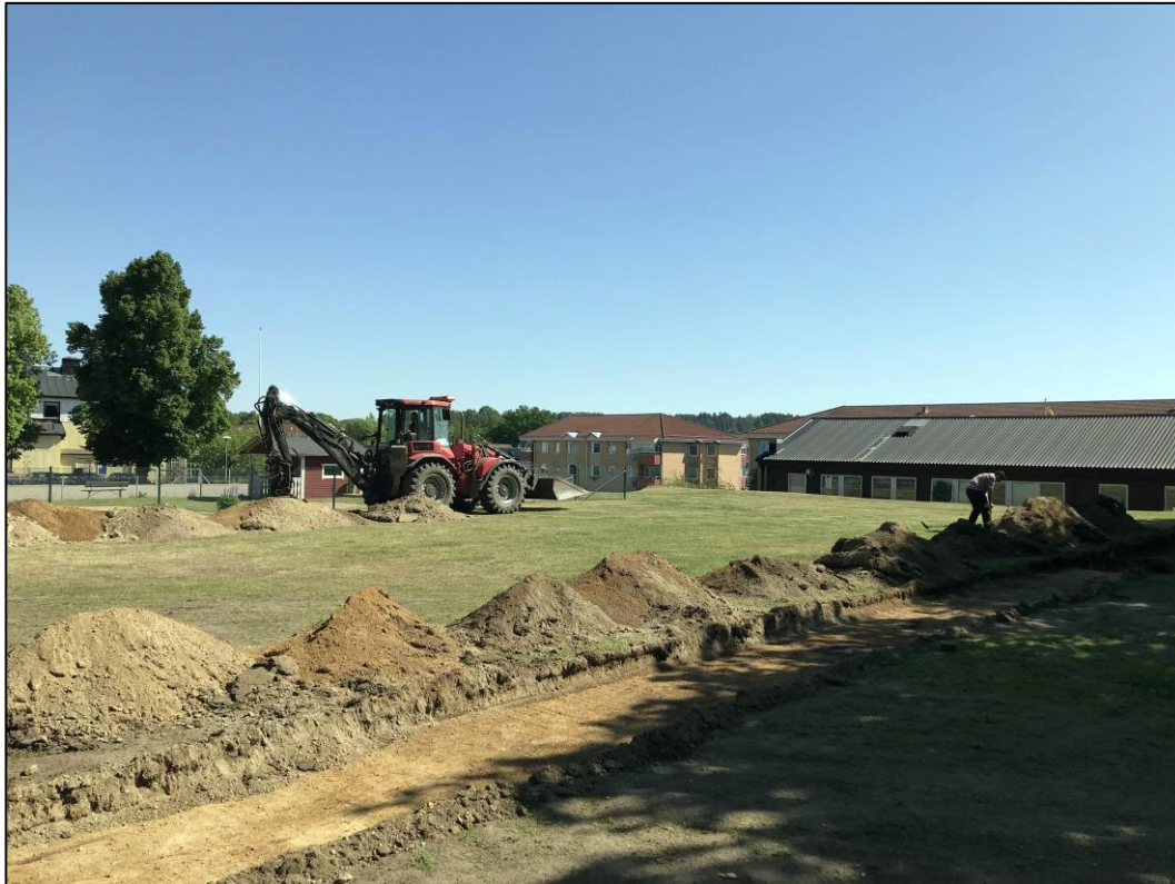
Fig.3 – Södra delen av UO mot nordost.