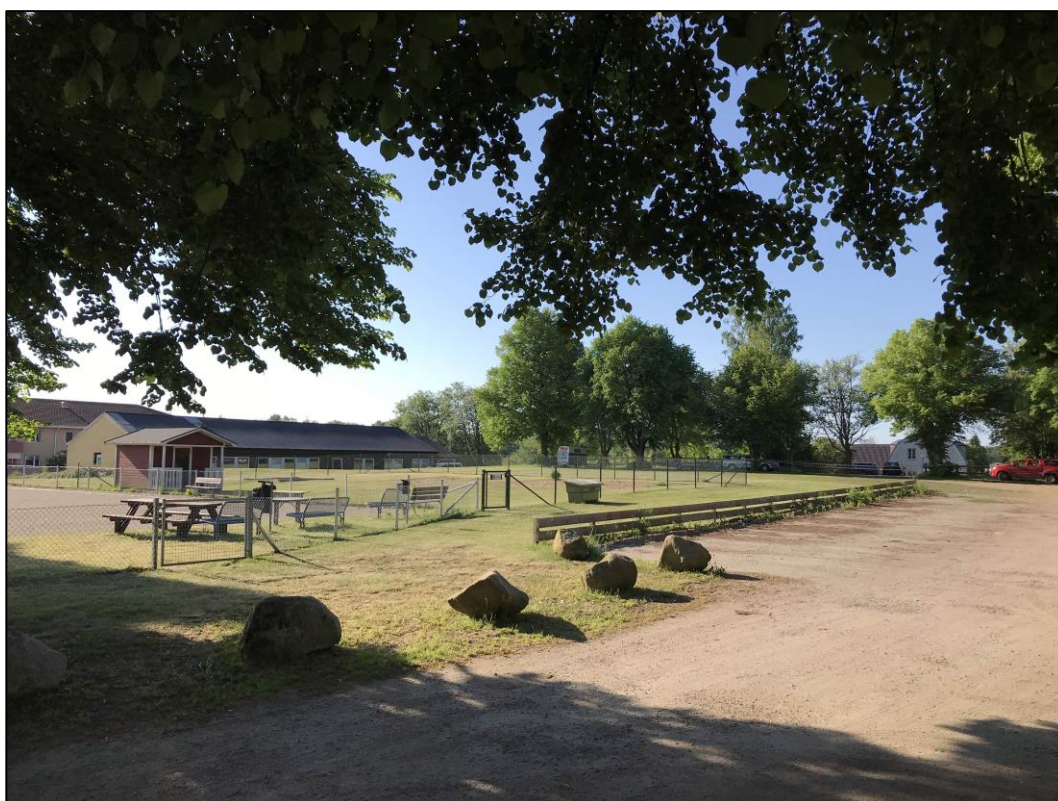
Fig.2 – Nordvästra delen av UO mot sydost.