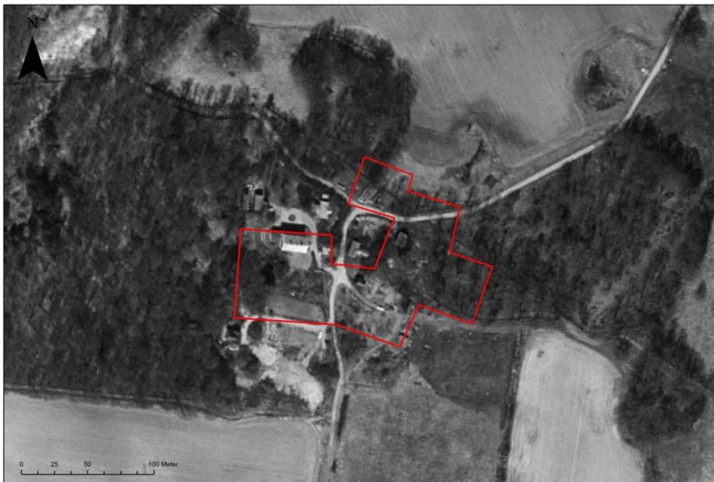
Bytomtens bildskärmsdigitaliserade sträckning för inregistrering i FMIS.