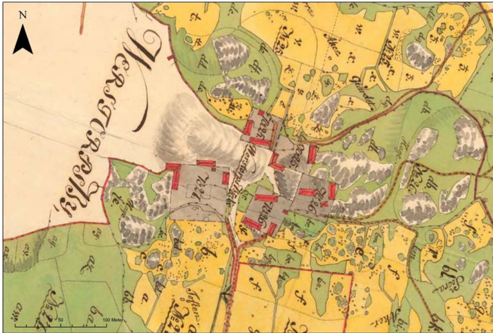
Detaljbild 1780-talets bytomt.