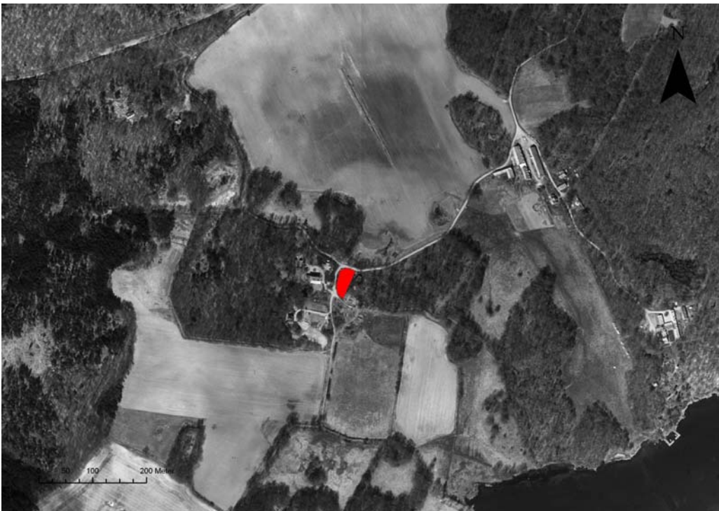
Fig.1 – Utredningsområdet markerat på fastighetskartan.

Inför en planerad nybyggnation av ett enbostadshus inom fastigheten Verstorp 2:20, uppdrog länsstyrelsen åt Blekinge museum att utreda den antikvariska situationen inom planområdet. Länsstyrelsen utförde av denna anledning en särskild utredning inom området under oktober 2009. Föreliggande avrapportering utgör en redovisning av det utförda uppdraget, vilket bekostats av länsstyrelsen genom 7:2-anslaget.