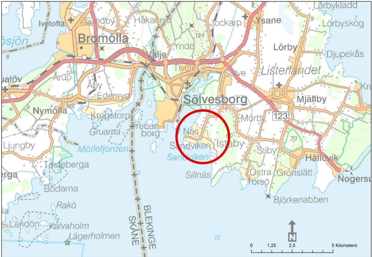
Fig.1 Undersökningsområdet markerat på Översiktskartan