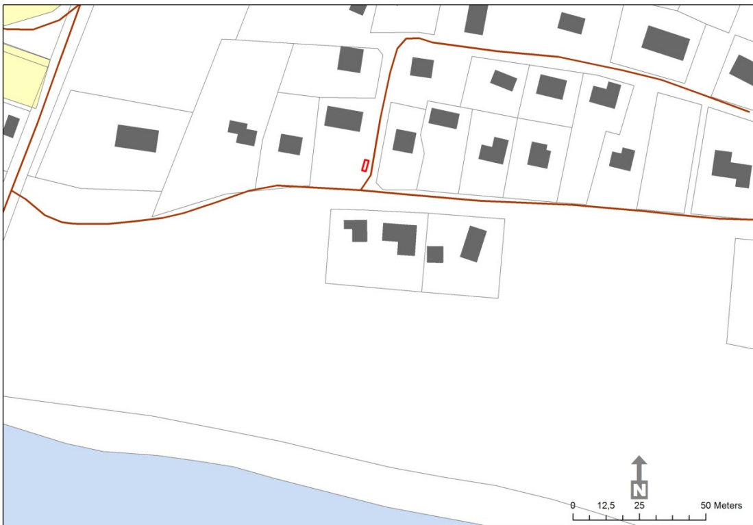
Fig.3 Schakt i undersökningsområdets södra del