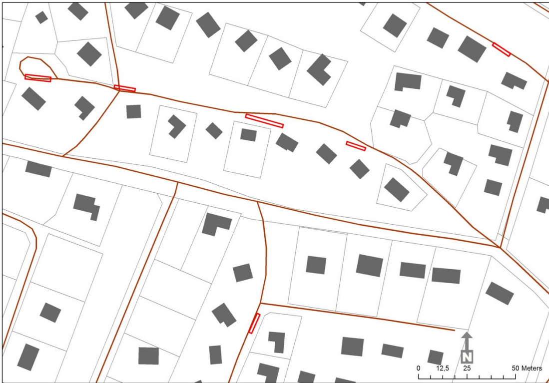
Fig.2 Schakt i undersökningsområdets norra del