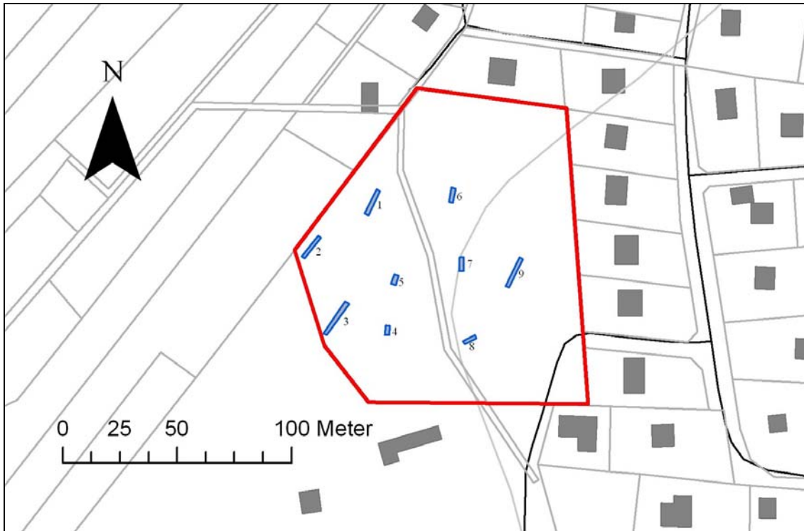
Sökschaktens placering inom aktuellt utredningsområde.