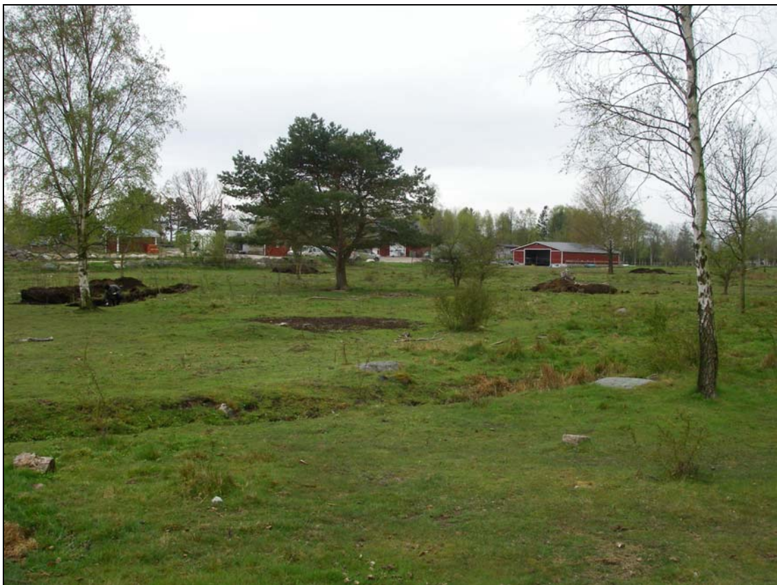
Del av utredningsområdet fotograferat mot SV.