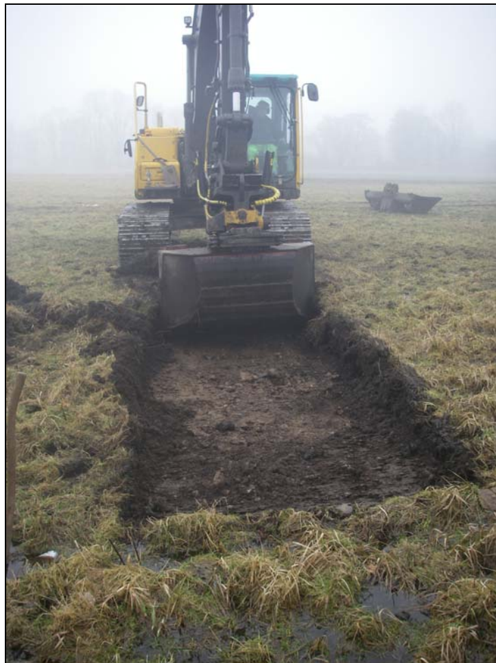
Inledande schaktning inom det norra utredningsområdet.