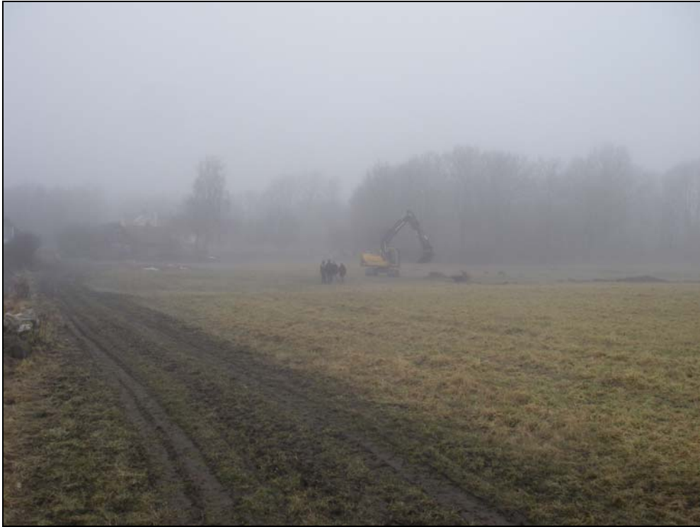
Norra utredningsområdet fotograferat mot NNV.