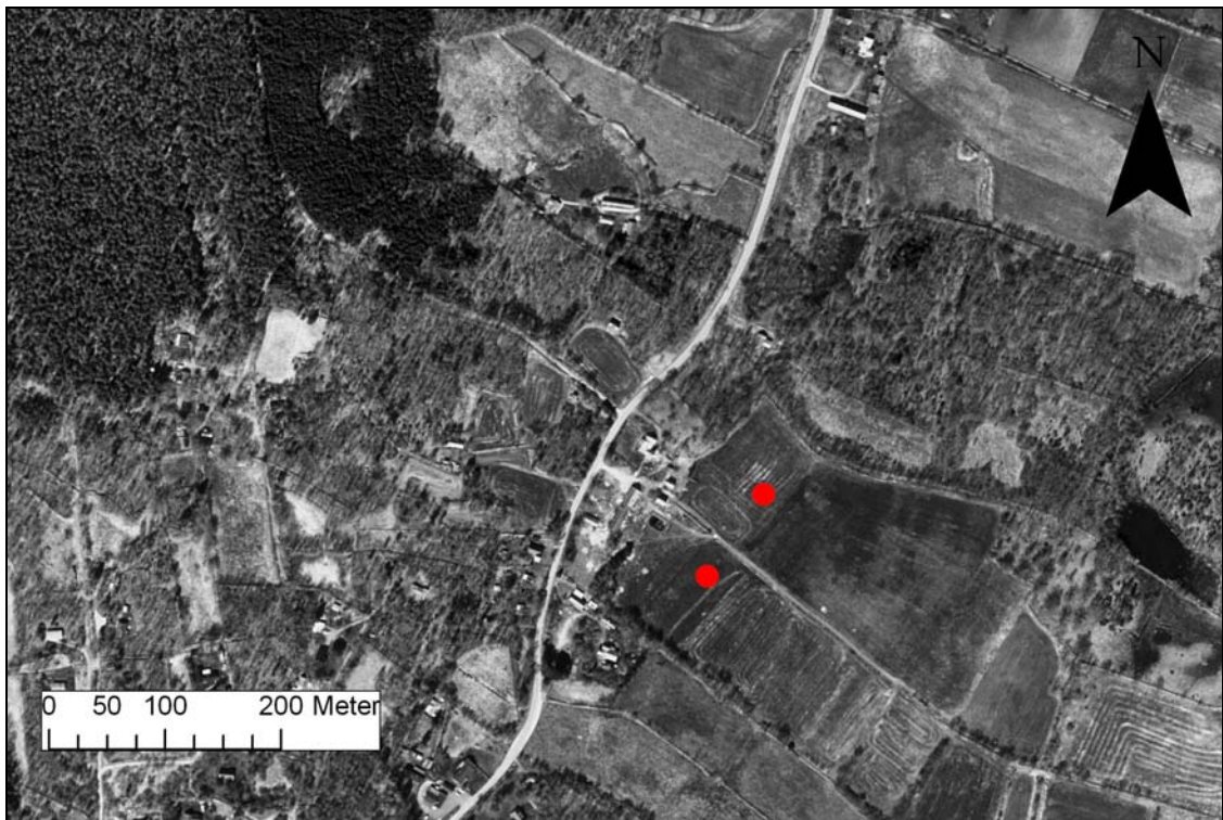
Ungefärliga centralpunkter för de planerade dammarna.