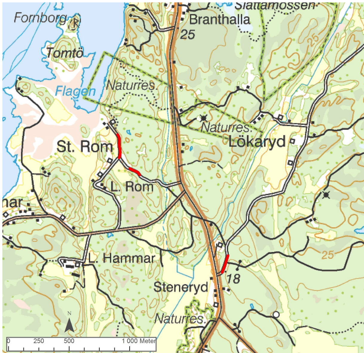
Figur 2 Antikvariskt kontrollerad linjesträckning markerad på Terrängkartan