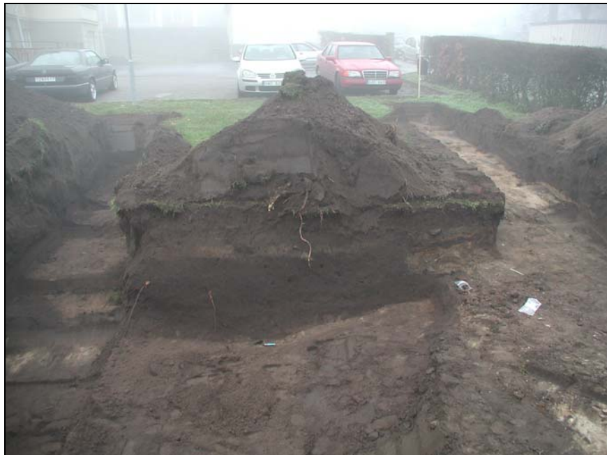
Överblick schakt 2 och 3 samt sektion A-B mot NV.