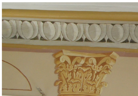
Fig. 2. Sprickan lagad och avförd.