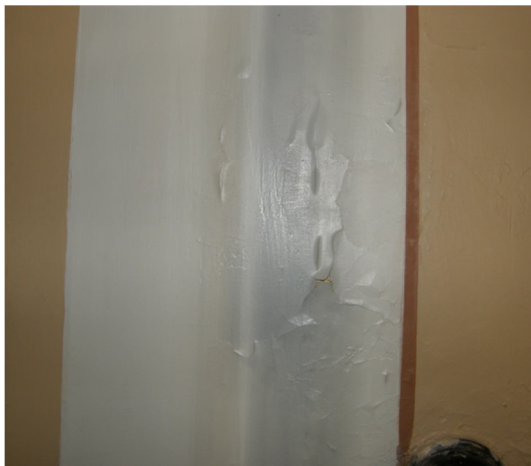
Fig. 4. Exempel på flagad färg.

Färgflagningar lagades genom att flagorna först mjukades upp med ånga, skapad genom att värma med strykjärn på blöt trasa, som pressades mot bakplåtspapper lagd på väggyta. De mjuka flagorna trycktes därefter fast med strykjärn och bakplåtspapper (fig. 6). Efter intryckning av flagor limmades de synliga sprickorna mellan fast och flagad färg med vattenbaserat lim (förgyllningsgrund som ej missfärgar, Wunda Size Syntetic). Limmet fördelades och maserades in för hand. Efter limning torkades överskottsmaterialet bort med fuktig trasa.