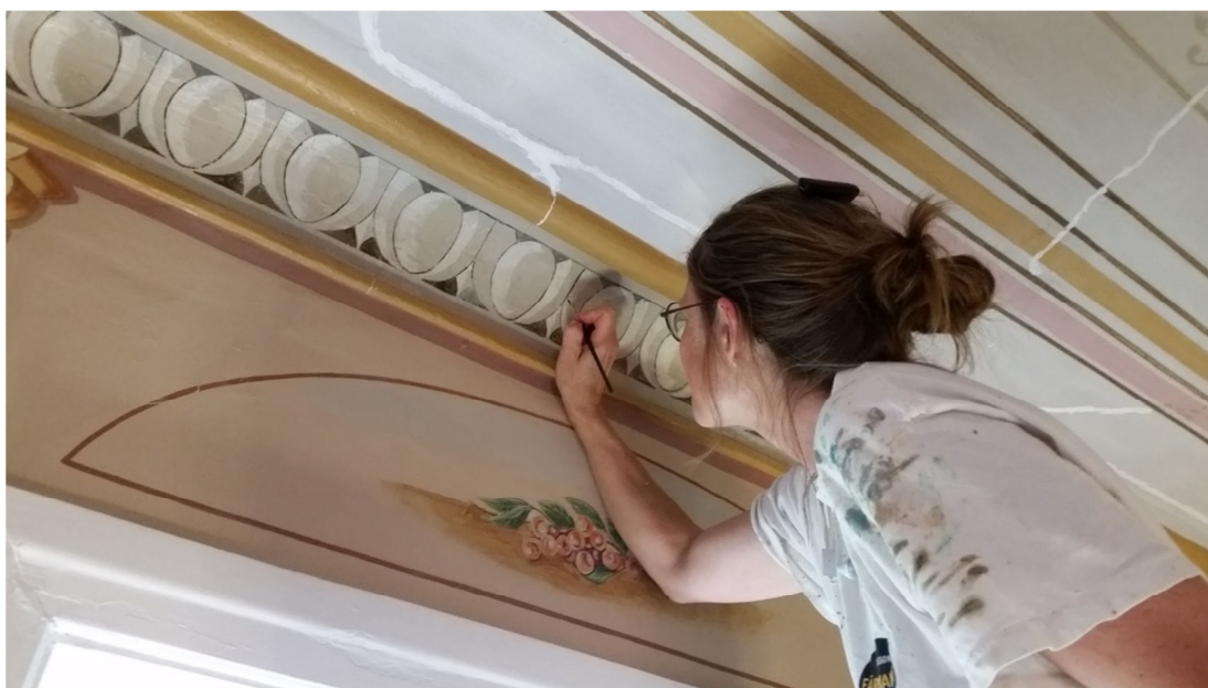
Fig. 3. Imålning med oljefärg efter spricklagning, södra hålkälslisten.