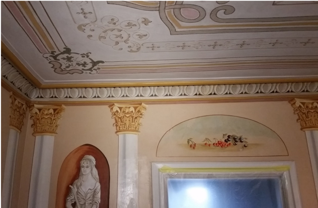
Fig. 7. Vy mot norra väggen, vänstra delen, under arbetet.