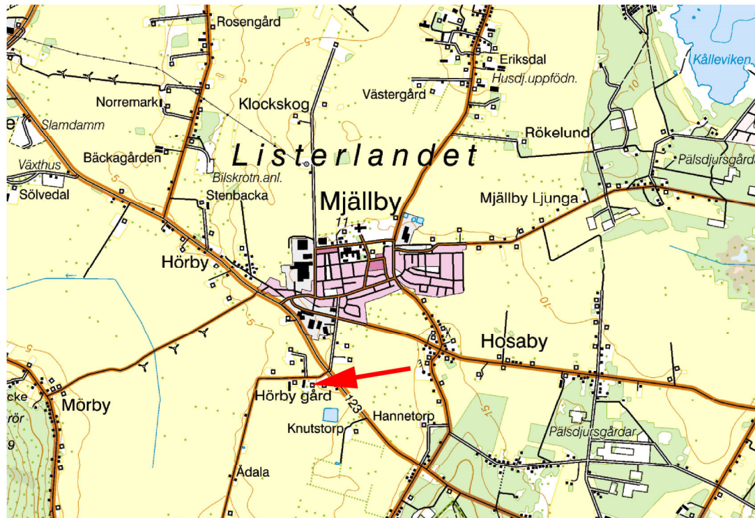
Del av Mjällby socken, Hörby 1:95 markerad.