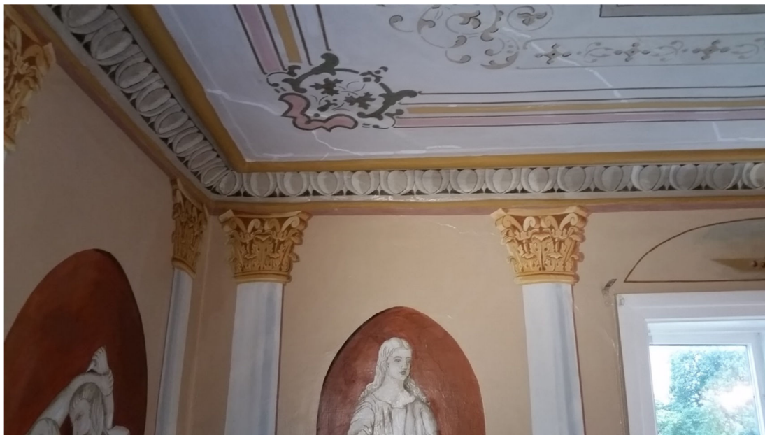
Fig. 9. Lagade taksprickor i sydöstra hörnet. Under arbetet.