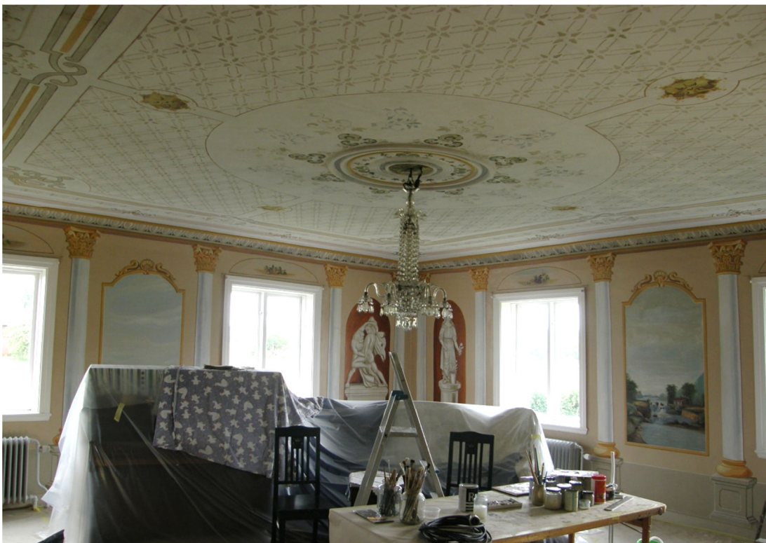
Fig. 8. Vy mot sydöstra hörnet, efter arbetet.