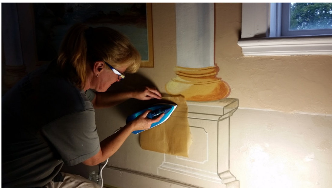
Fig. 6. Fasttryckning av flagat färgparti, efter mjukgörning.