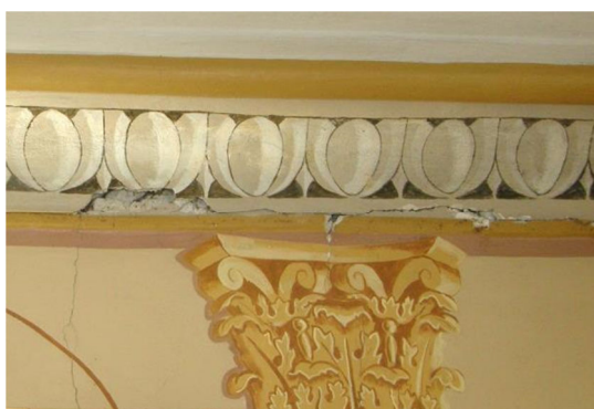
Fig. 1. Spricka på östra hålkälslisten.

Sprickor – till övervägande delen på östra och södra takpartierna – har varsamt fyllts igen med gipsbaserat lagningspackel (ARDEX A 828), påförd med spatel (se exempel på fig. 3 och 9). Likaså har lösa delar av hålkälslisten, på östra sidan, omfästs på ursprunglig plats med gips som fästmedel. Viss uppbyggnad med gips utfördes även vid mindre partier på hålkälslisten, där putsen fragmenterats i samband med sprickbildningen. Efter att gipset härdat skedde ommålning direkt på lagning med platsblandad limfärg (fig. 3), vilken efter påförning torkades med varmluft (fön).