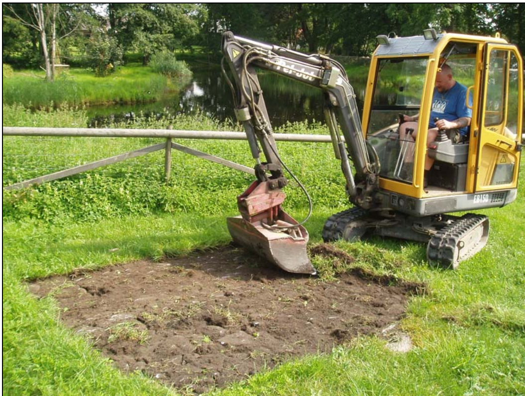
Fig.2 - Påbörjad grävning av Schakt 5, fotograferat mot NO.

Det arkeologiska förundersökningsarbetet utfördes 2007-08-08. Gropar för träden grävdes med en minigrävare, under ledning av Blekinge museums arkeolog, till ett genomgående djup om ca 1,0 m. (fig.2). Kompletterande grävning och framrensning gjordes för hand, och fyndinsamlingen skedde genom handplock. Schakten lägesbestämdes med hjälp av kommunala GPS-mätningar, och inhämtade fältdata efterbearbetades i ArcGIS 9. Dokumentation utfördes i övrigt med digitalkamera.