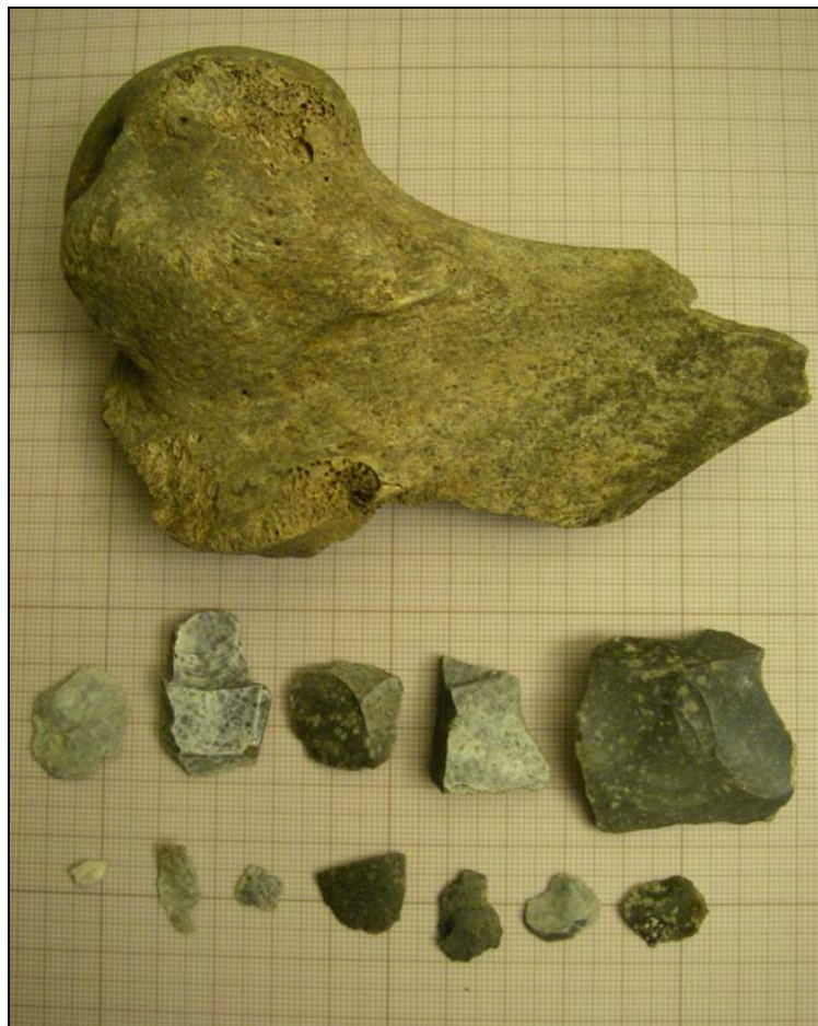
Fig.3 - Fynd från nedgrävningen i Schakt 1 .

Bortsett från de sannolikt förhistoriska indikationerna i Schakt 1 framkom inga spår av särskilt, antikvariskt intresse i samband med förundersökningen. De sammanhängande, stenlagda ytorna speglar inte minst 1800-talets funktionella behov i anslutning till platsens ekonomibyggnader.