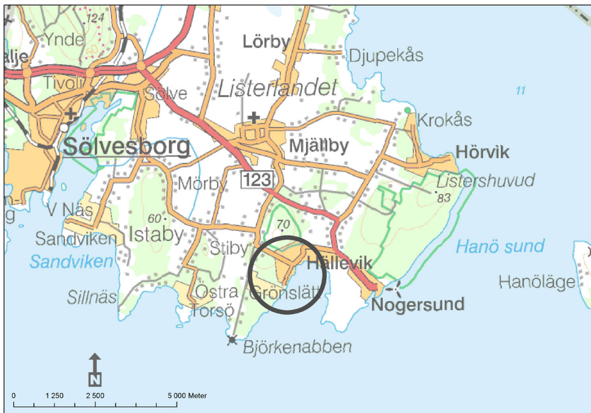
Fig 1 Undersökningsområdet markerat på Översiktskartan