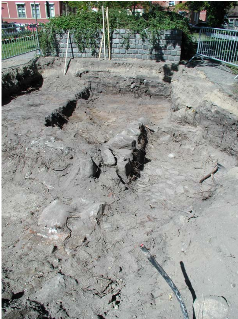
Fig.3 – Översiktsbild av schakt, fotograferat mot NV.

Det arkeologiska förundersökningsarbetet utfördes mellan 2004-06-03 och 2004-06-04. Schaktning med grävmaskin genomfördes under ledning av antikvarie från Blekinge museum. Påträffade, antikvariskt intressanta strukturer rensades fram för hand och dokumenterades löpande med totalstation. Inmätningarna gjordes i fält av mättekniker Mikael Strid från SEVAB. Dessa mätdata utgjorde sedan grunden för Blekinge museums vidare GIS-bearbetning mot fastighetskartan och RT-90 i datorprogrammet ArcView 8. Dokumentation genom digitalfotografering skedde fortlöpande under arbetets gång och ett representativt fyndmaterial tillvaratogs.