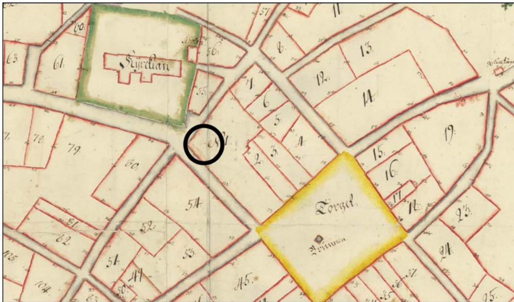
Fig.4 - Geometrisk avmätning 1725, Zakarias Almgren

Inom den framschaktade ytan framkom inte minst byggnadsspår i form av omfattande stenmursrester (fig.3 resp. bilaga 1). Dessa bestod av 0,40 till 0,70 m breda och upp till 0,5 m höga fundament av murade, otuktade, 0,20 – 0,40 m stora gråstenar. Bland dessa påträffades även sporadiska inslag av inmurat tegel. Innanför murresterna fanns endast påförda, sentida lager samt en mindre, stensatt yta. Ett ca 9 m 2 stort och omkring 0,10 m tjockt, avsatt kulturlager bestående av sotig sand framrensades i schaktets norra del på en nivå om 6,10 m.ö.h. Lagret fortsatte i SO riktning, men var här mer fyndfattigt och stört av moderna grävarbeten samt en ytlig, sentida stenläggning. Vid bortgrävning av den sotiga kulturlagerresten tillvaratogs sammanlagt 395 gram Kristianstadflinta samt en sannolik knacksten av bergart. Fyndmaterialet bestod i huvudsak av avslag och splitter. Träkol för eventuell, framtida analys samlades in från en större sotfläck. Dessutom insamlades ett representativt urval av fynd från schaktets omrörda lager. Detta bestod främst av en mindre mängd slagg, fragment av ett par kritpipor samt keramik av typerna yngre rödgods och stengods.