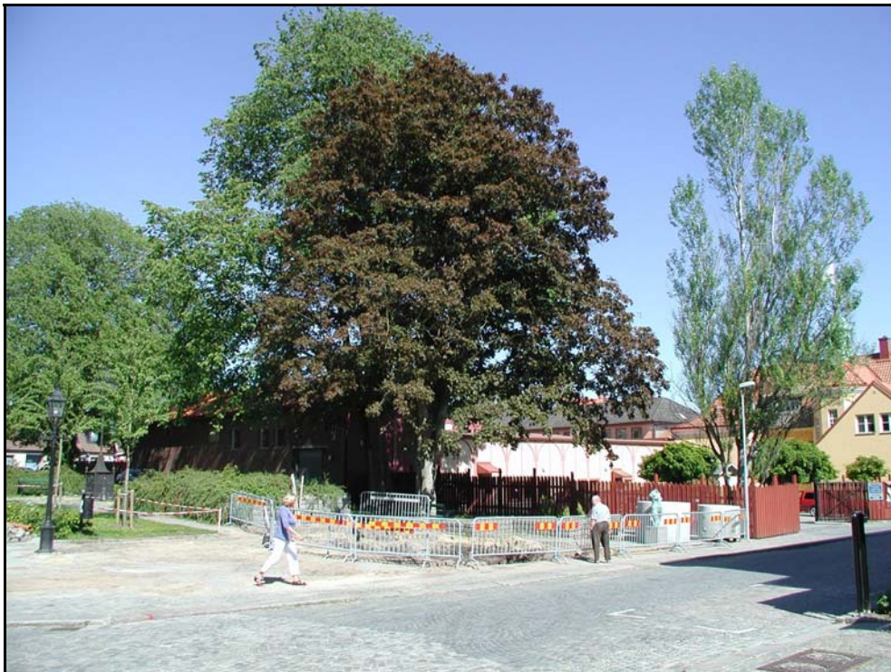
Fig.2 Undersökningsområdet i kv. Anden fotograferat mot Ö.

Nivåskillnaderna är påtagliga inom det centrala stadsområdet och terrängen sluttar successivt från omkring 9 m.ö.h., mot söder och öster, ner mot havsnivån. Det aktuella exploateringsområdet utgjordes av en drygt 50 m 2 stor yta på den norra sidan av Västra Storgatan. Tomten ligger mitt emellan Stortorget och S:t Nicolai kyrka, och följaktligen i hjärtat av den medeltida stadskärnan. Det medeltida stadsområdet (RAÄ 44, Sölvesborgs socken) har vid ett flertal tillfällen varit föremål för antikvariska insatser i samband med byggnationer och andra anläggningsarbeten. Inte minst under 1900-talets andra hälft har ett stort antal undersökningar kommit till stånd inom fornlämningen (se ex. Söderberg 1992 s.8. resp. Anglert 1984 s.21 ff.). I samband med exploatering för park och parkering inom kvarteret Anden år 1978 utförde RAÄ UV Syd sökschaktningar strax norr om den aktuella undersökningsytan. Ett 0,2 – 0,4 meter tjockt, mörkt, sandigt humuslager påträffades under matjord och omrörda lager, på en nivå omkring 6 m.ö.h. Med undantag för en keramikskärva av svartgodstyp framkom inga fynd vid 1978 års undersökning (se Jeppsson 1990).