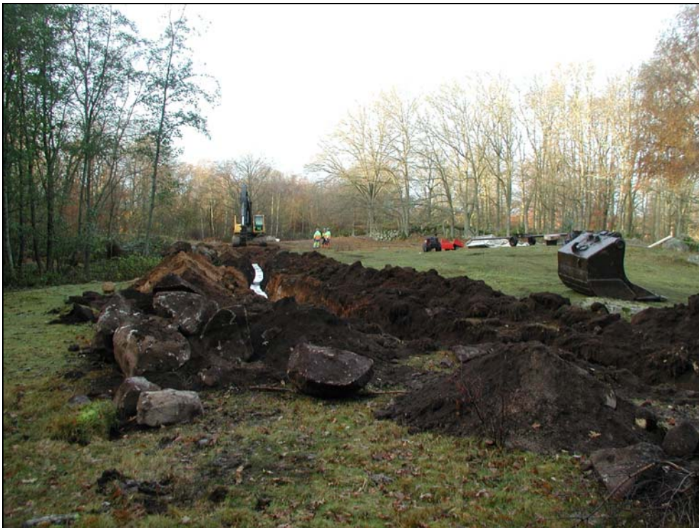
Fig 2 – Kuperad hagmark inom undersökningsområdet.

Inledande rekognoscering av exploateringens sträckning genomfördes vid två tillfällen av museets arkeolog tillsammans med representanter för den ekonomiska föreningen Leva i Bökevik. Det arkeologiska utredningsarbetet utfördes sedan i form av löpande antikvariska schaktkontroller i samband med att exploateringens anläggningsarbeten fortskred.