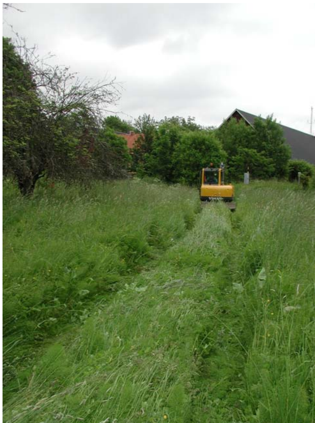
Fig.2 Platsen för schakt 11 mot öster, i bakgrunden Rosenholms ekonomibyggnader.

Bortsett från en diffus, 0,6 meter stor sotfläck i schakt 11 utgjordes anläggningsbeståndet inom hela utredningsområdet enbart av dräneringsspor eller recenta gropar och störningar. Ett mindre fyndmaterial i form av främst keramikfragment från nyare tid, enstaka avslag av flinta och kvarts samt fragment av kritpipor och ett par patronhylsor tillvaratogs från schakten 3, 4, 7, 9 respektive 10. Det största antalet schaktningsfynd gjordes i schakt 10. Träkolsprov insamlades från sotfläcken i schakt 11.