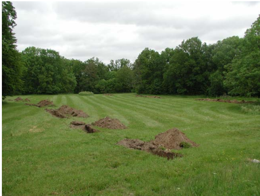
Fig.1 Utredningsområdet med schakt 1-9 mot norr.

Väderförhållandena för det arkeologiska fältarbetet 2004-06-14 var relativt goda då det var mulet och huvudsakligen uppehållsväder. Utredningsområdet var knappt 13000 m 2 stort och utgjordes av ängsmark, belägen omkring 12 – 14 m.ö.h. Den gräsbevuxna, plåtåliknande ängen sluttade successivt norrut, ner mot Silletorpsån. Längst i norr vek det öppna området av österut och fortsatte cirka 100 meter i riktning mot Rosenholms gård. Nio sökschakt (sökschakt 1-9) drogs ute på det öppna fältet (fig. 1) och ytterligare två (sökschakt 10-11) placerades i den östligast liggande utredningsytan (bilaga 2). Sökschakten mättes in manuellt och efterdigitaliserades mot fastighetskartan i programmet ArcView 8. Övrig dokumentation av fältarbetet gjordes med digitalkamera.