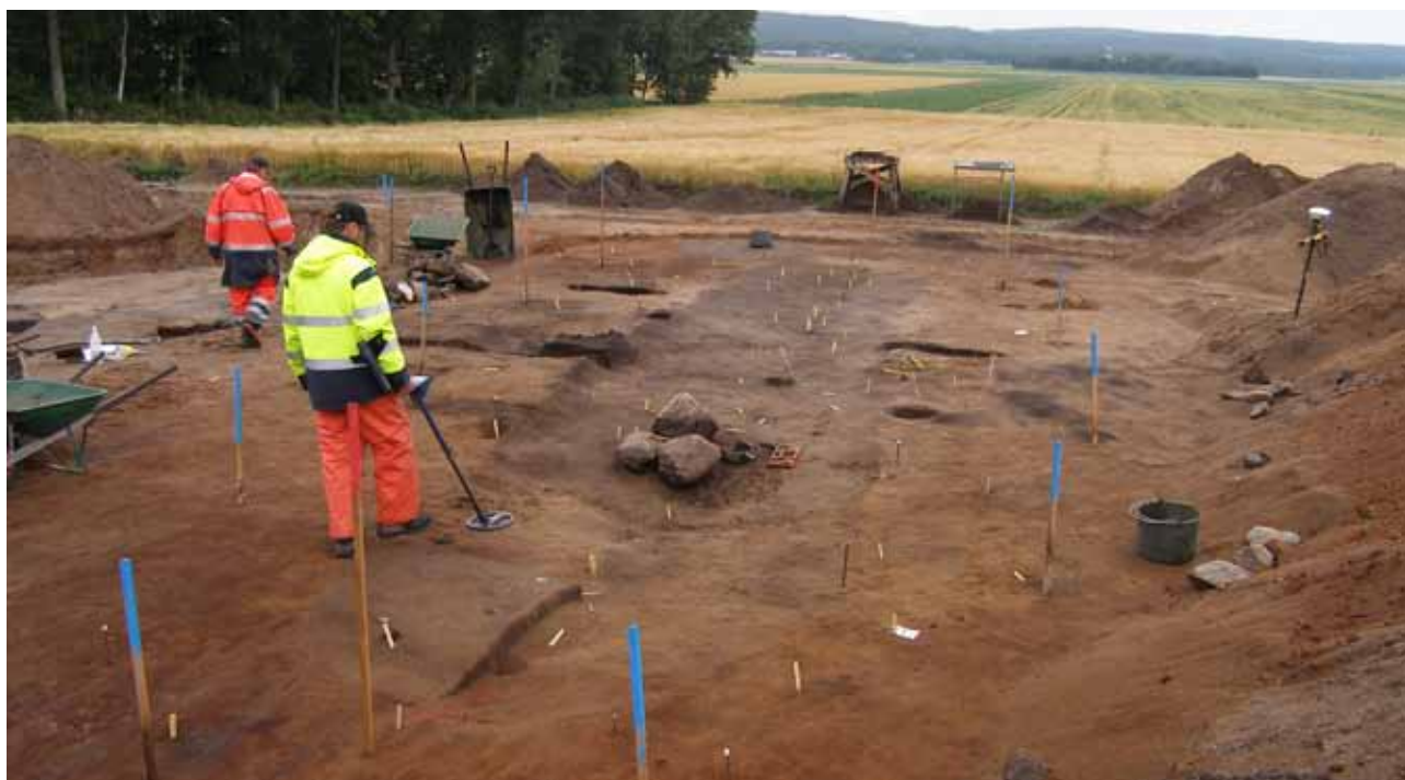
Fältarbete E 22 utgrävningen.

Den aktuella vägsträckningen löper utmed den utdikade sjön Vesans östra strand och berör ett flertal boplatsslämningar från mesolitisk tid till järnålder (ca 9000 f Kr–ca 500 e Kr.) Inom modern uppdragsarkeo-