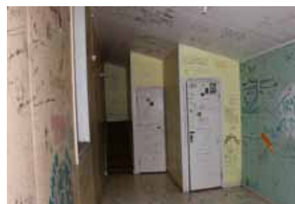
"Aufgrabfäggen" på Mastens festplats.