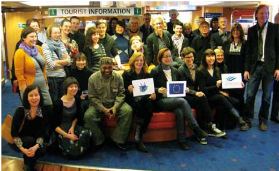
Samling inom Art Line-projektet i Polenfärjans entré för en snabb gruppbild innan avfärd. De lydiga deltagarna håller upp lappar som visar att Art Line är ett EU-projekt.