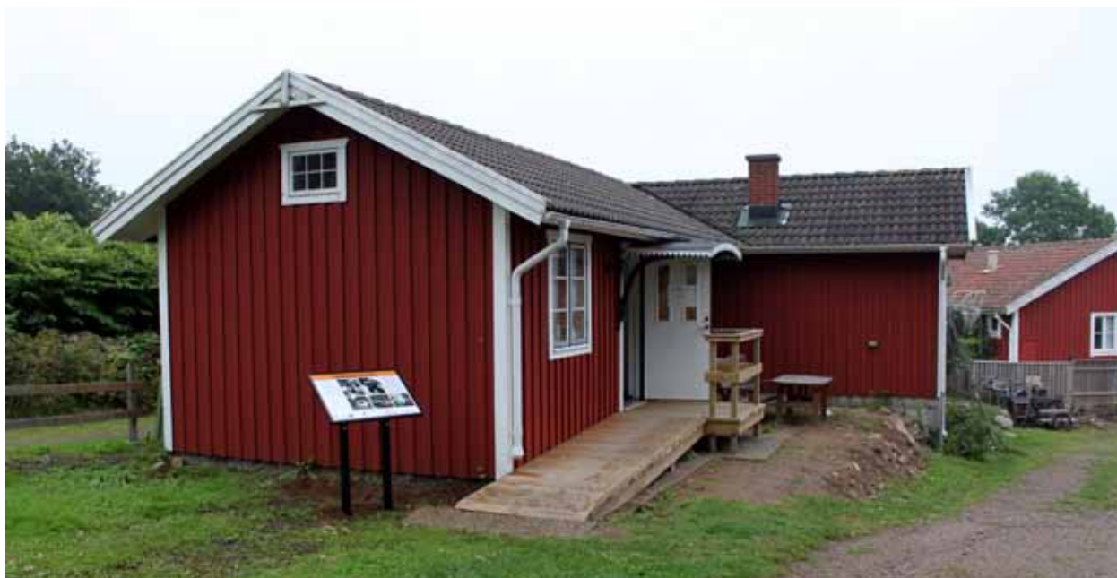
Det f.d. boningshuset vid Saxemara båtvarv renoverades och utrustades bl.a. med en ramp.

Ekonomisk redovisning utfördes åt Blekinge Hembygdsförbund.