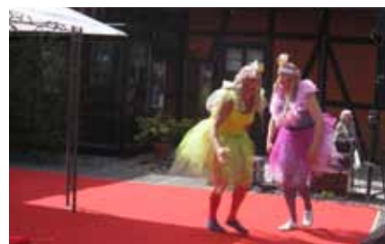
De skalliga tvillingssystrarna uppträdde på Stad & Land.