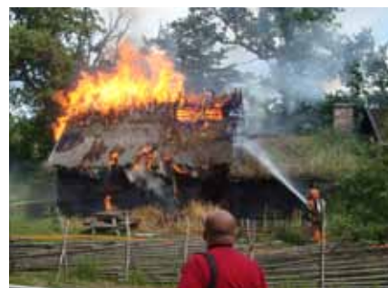
Lars Petterstugan eldhärjades i en anlagd brand i juni.