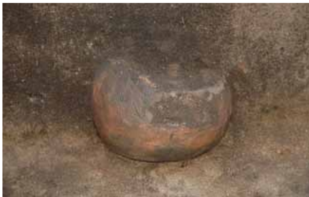
Gravurna från Bronsålder hittad vid utgrävningarna längs E 22.

logi är paleoekologi och kvartärgeologi väsentliga och integrerade delar. Genom kopplingar till klimatutveckling och miljöpåverkan ger de också arkeologin ökad aktualitet och samtidsrelevans. För de miljöhistoriska undersökningarna inom projektet svarar Högskolan i Kristianstad.