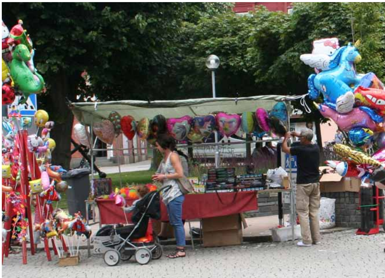
Killebom i Sölvesborg.

Personal från olika bibliotek i Karlskrona träffades en gång under året.