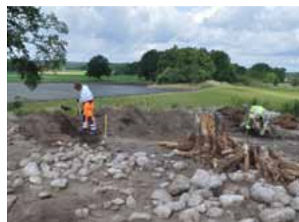
Utgrävning längs E22.