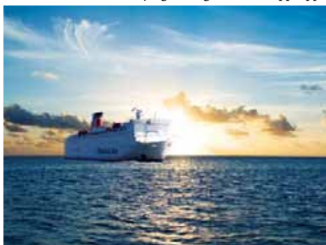
Telling the Baltic inleddes i onsdags ombord på Stena Vision.