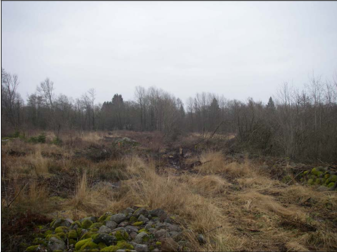
Nordligaste delen av utredningsområdet fotograferat mot Ö.