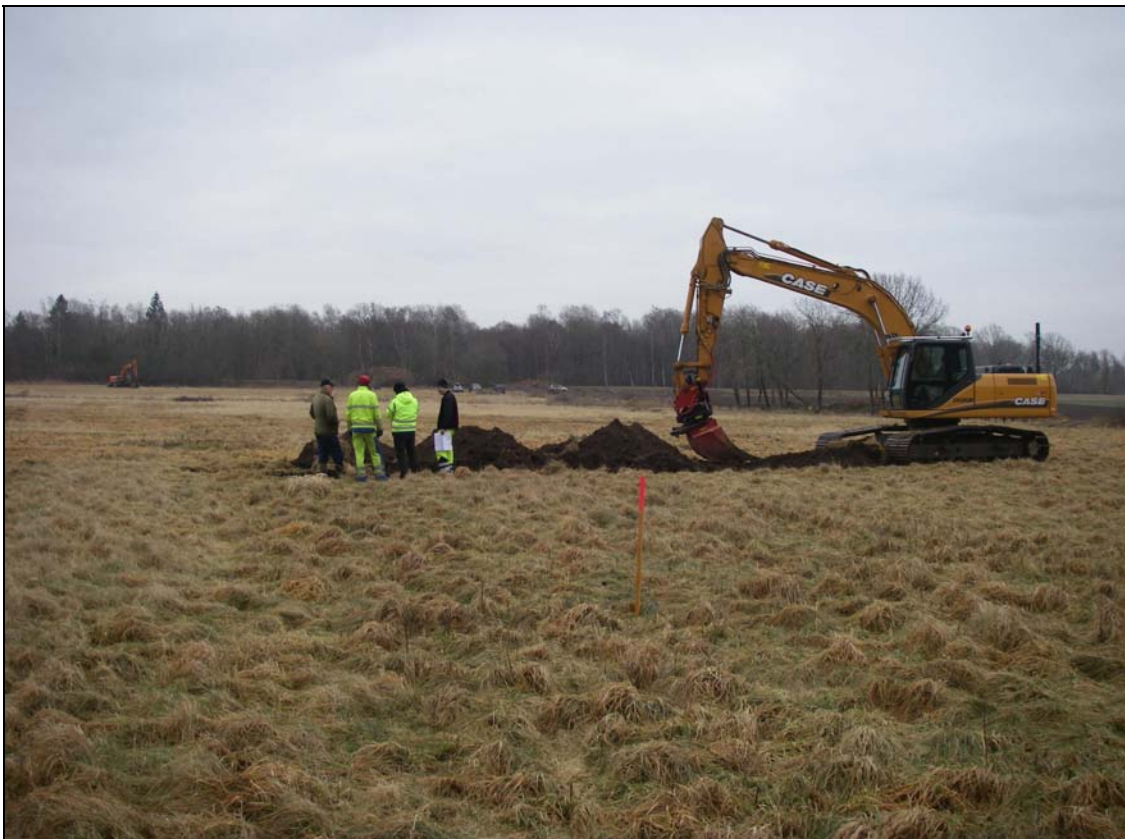
Markägare och projektören i samråd vid västligaste sökschaktet.