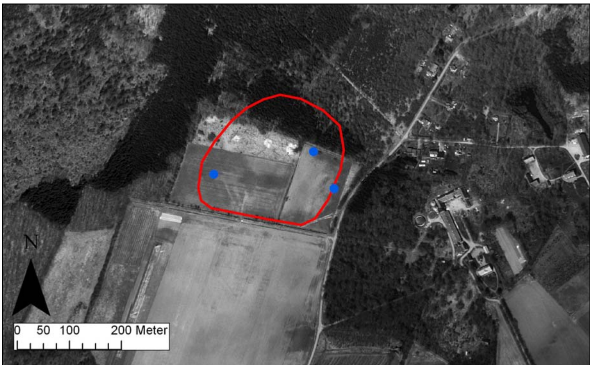
Exploateringsområdets ungefärliga sträckning samt med punkter markerade sökschakt.