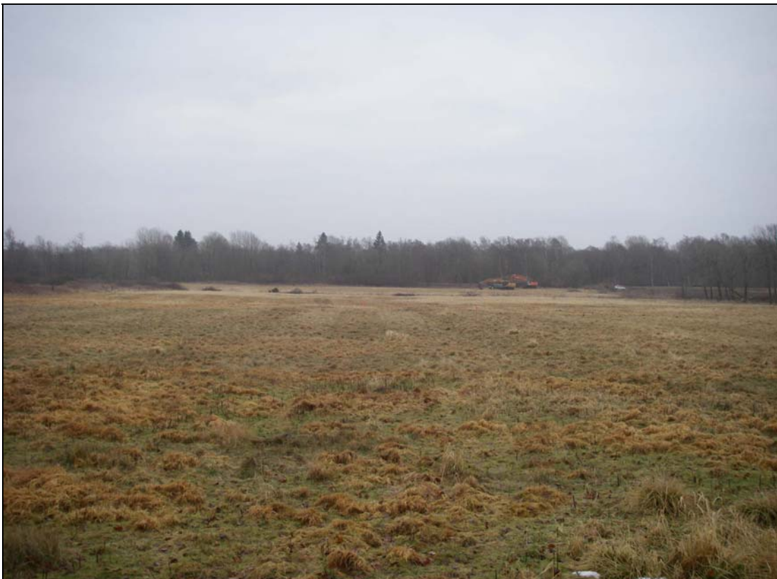
Del av utredningsområdet fotograferat mot Ö.