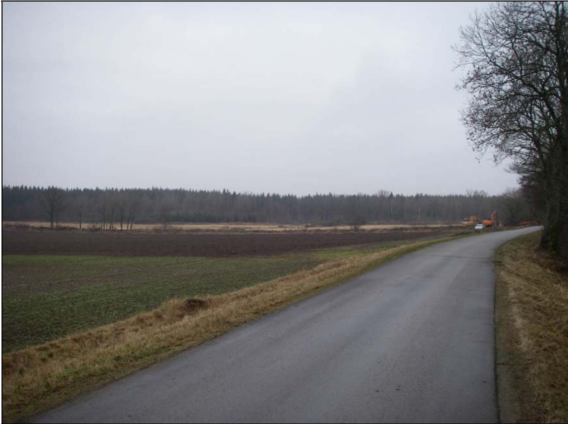
Utredningsområdet fotograferat mot NNV.