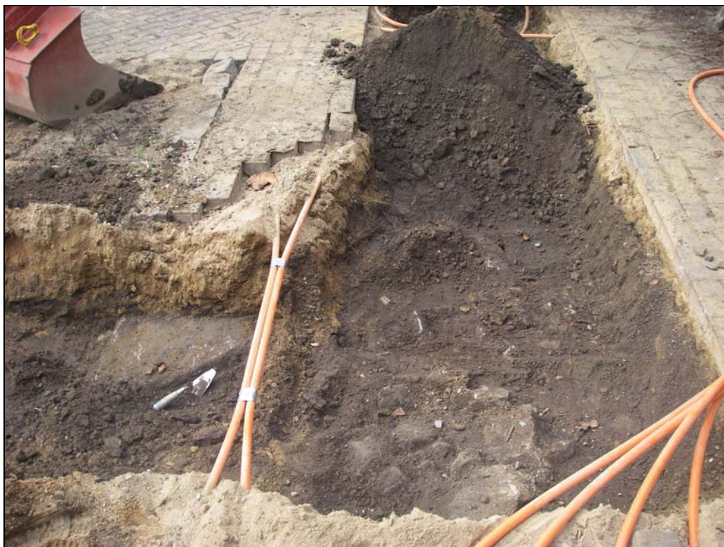
Arkeologiska spår påträffade på innergård i den sydligaste delen av schaktet.