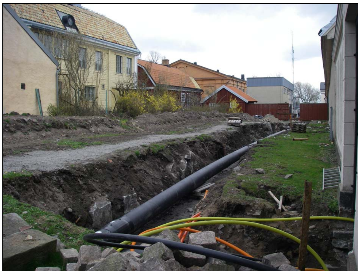
Översiktsbild mot NO över exploateringsschaktets nordligaste sträckning.