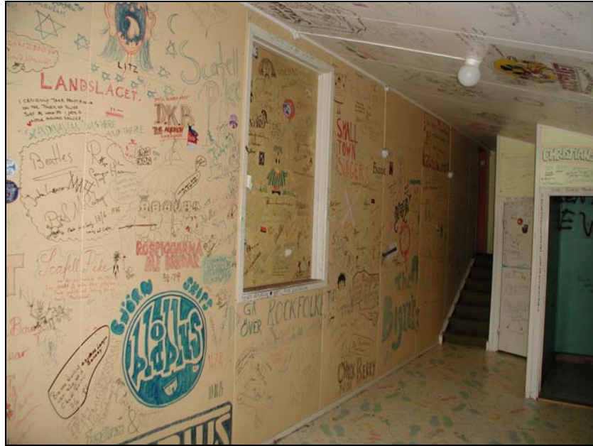
Fig.5 Interiör från Scenbyggnad 1 med exempel på artistklotter.