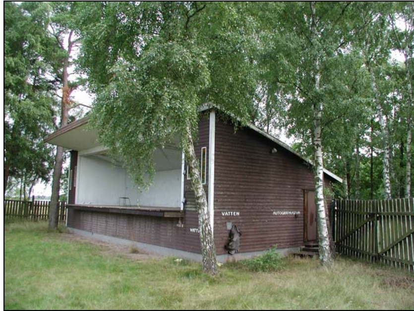
Fig.4 Scenbyggnad 1 mot Ö.

Namnet Masten klingar på ett särskilt sätt för de generationer av nöjestörstande människor som genom årens lopp vallfärdat hit för diverse evenemang. Inför ett stundande rivningsskede finns det inte minst därför anledning att göra en grundlig fotografisk dokumentation av festplatsens rumsliga användning och dess byggnader, ur en kulturhistorisk aspekt. Det är dock minst sagt önskvärt att den sydligast placerade av scenbyggnaderna får finnas kvar även fortsättningsvis, och i någon form förmedla lite av Mastens karaktär. Just denna lokal får sägas vara en veritabel kulturhistorisk skatt, vilken speglar platsens forna attraktionskraft. Med rätt omsorg och presentation kunde kanske denna byggnad utgöra ett spännande komplement till spåren efter såväl Avaskär som Kristianopel, vilka även dessa förtjänar en mer framskjuten exponering i närområdet. Såväl lokalt boende som en i övrigt intresserad allmänhet skulle genom scenbyggnadens bevarande kunna erbjudas en inblick i en svunnen era av underhållningshistorien, även långt efter att Mastens alla övriga byggnader fått skatta åt förgängligheten.