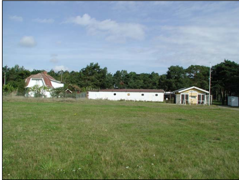
Fig.2 Mastens festplats fotograferad från söder.