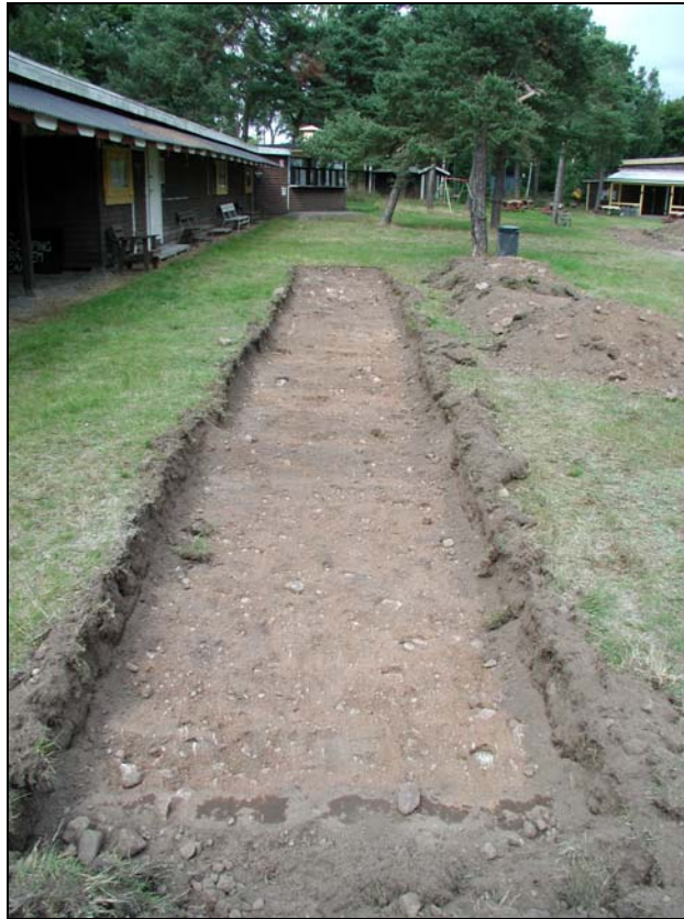
Fig.3 Överblick Söschakt 4 mot N.

påträffades vid grävningarna. Utifrån de grävda sökschaktens inbördes placering, lagerföljdens närmast identiska utseende samt en genomgående avsaknad av arkeologiska fynd, lager och anläggningar bedömdes resultaten vara representativa för hela undersökningsområdet.