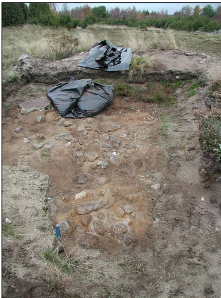
Fig.3 – Framrensad, stenig yta inom norra delen av undersökningsområdet.