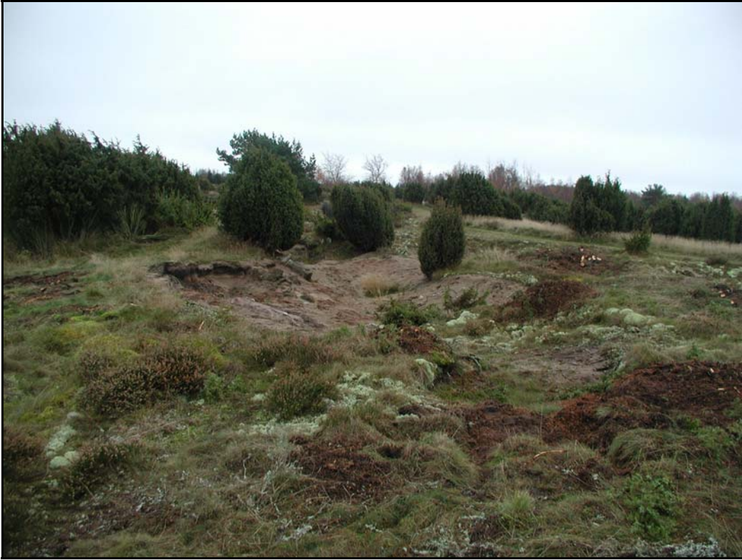
e. - Överblick sandtäkt på Lyckebacken mot S.