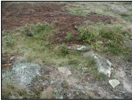
Fig.5 – Rester av hällkistor