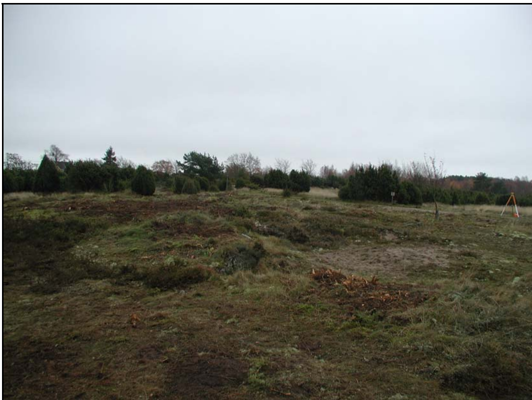
d. - Överblick Lyckebacken mot S.