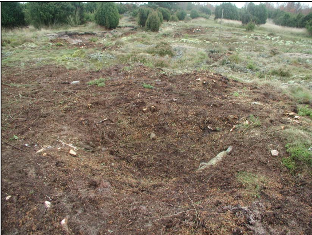
h. - Detalj borttagen hällkista mot S.