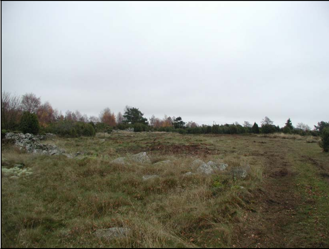
a. - Överblick från Lyckebackens nordligaste del mot S.