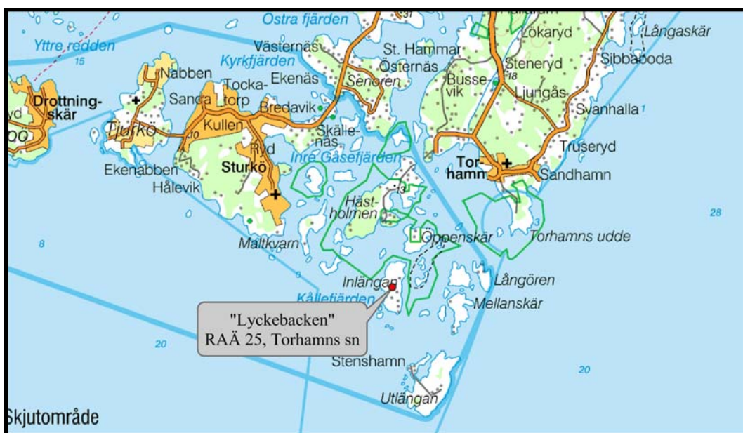
Fig.1 – Inlängans placering i Blekinge östra skärgård.

Sedan 2003 pågår ett projekt kopplat till fornlämningsmiljön på ön Inlängan i Blekinge östra ytterskärgård (se fig.1). Den huvudsakliga intentionen med detta har varit att ta ett helhetsgrepp kring resterna av det tidigare hällkistegravfältet, kallat Lyckebacken uppe på öns samfällda mark. Fältarkeologiska insatser har kombinerats med riktade vårdinsatser av närområdet med avsikt att återställa platsens kulturlandskapsmässiga karaktär på bästa tänkbara sätt. Föreliggande rapport utgör en sammanfattning av fältinsatserna för 2004, vilka i sin helhet bekostades av länsstyrelsen i Blekinge län, genom 28:26-anslaget.