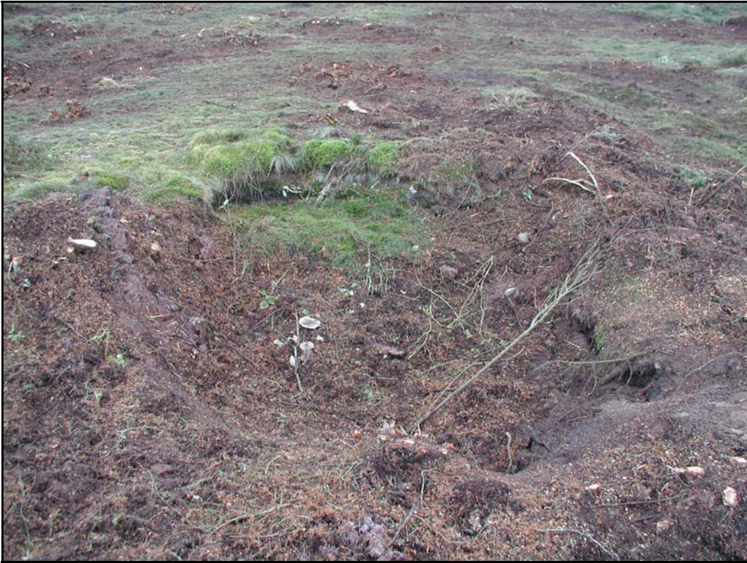
g. - Detalj borttagen hällkista.