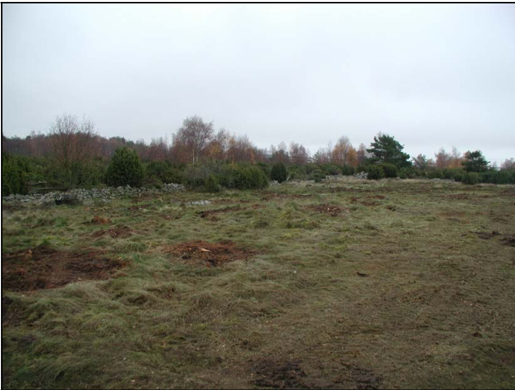
c. - Överblick Lyckebacken mot SO.