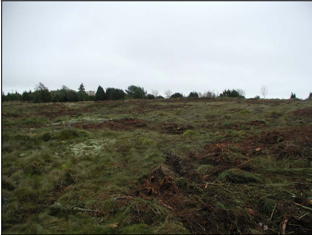
b. - Överblick Lyckebacken mot S.