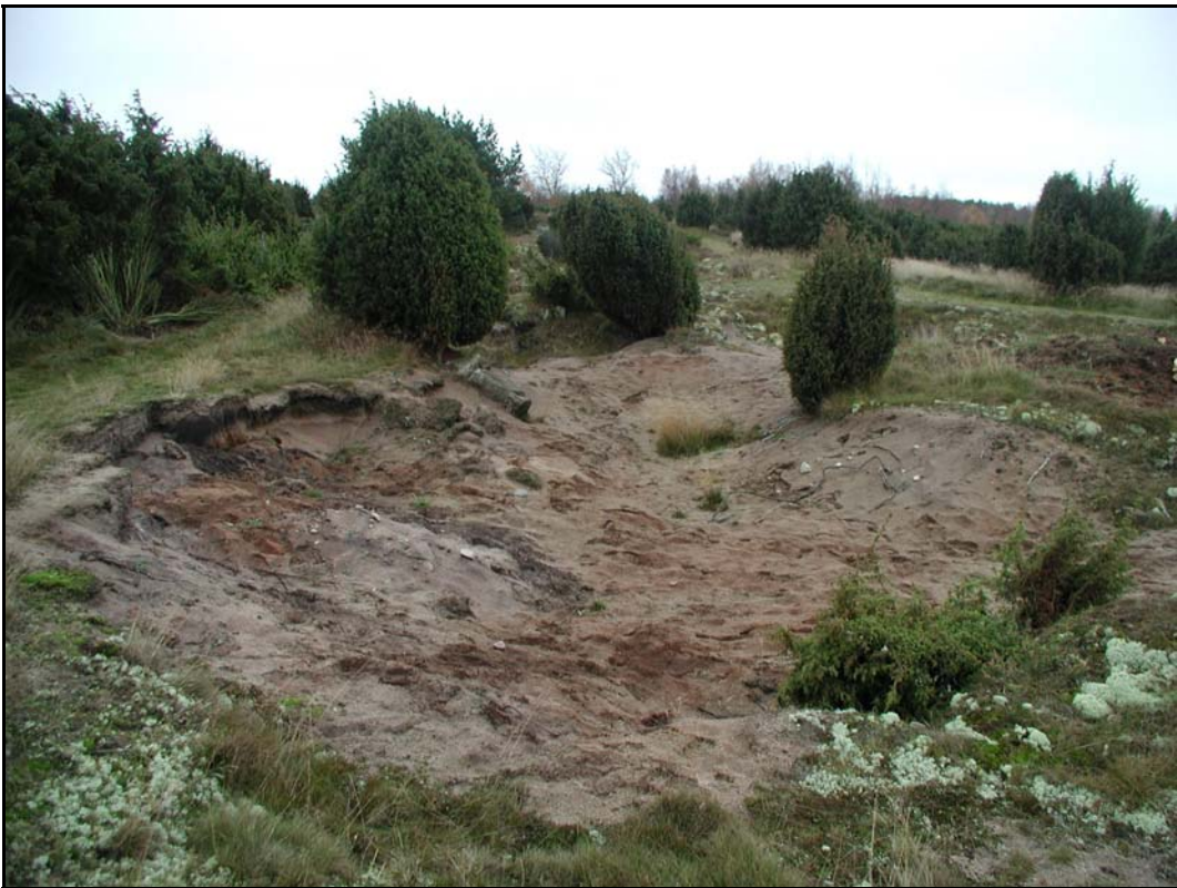
f. - Detalj sandtäkt på Lyckebacken mot S.