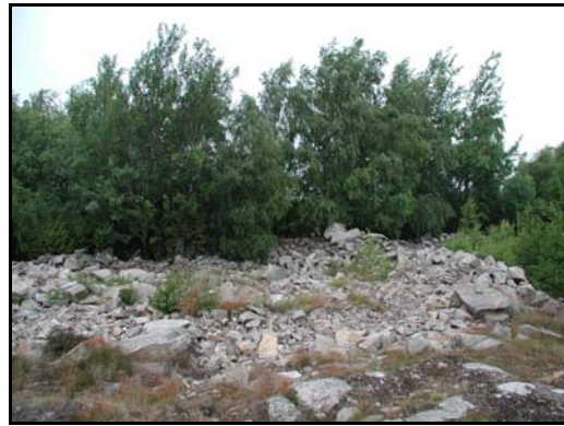
Fig.6 – Kvarlämnad skrotsten

skötselåtgärder tog sin början i och med avverkningarna hösten 2004. Resterande avverkningar kommer att genomföras under hösten 2005, parallellt med att återställningsarbetet kring de öppna sandtäckerna inleds. Intentionen bör även vara att snarast möjligt komma igång med diskussioner gällande pedagogiskt genomtänkta rekonstruktioner på platsen för de tidigare borttagna hällkistorna. Sådana nyskapade objekt kan sedan, tillsammans med äldre strandlinjer och klapperstensfält förhoppningsvis utgöra pedagogiskt välbeskrivna och omsorgsfullt skyltade natur- och kulturinslag längs öns förbipasserande vandringsled. Användbart material såsom hällar från tidigare borttagna hällkistor och bruten skrotsten finns tillgängligt på Lyckebacken resp. i dess absoluta närhet. I stor utsträckning går det att nyttja denna tillgång, och slutligen, på så vis söka återskapa lokalens karaktär till gagn för kulturmiljövårdens alla tänkbara intressen.